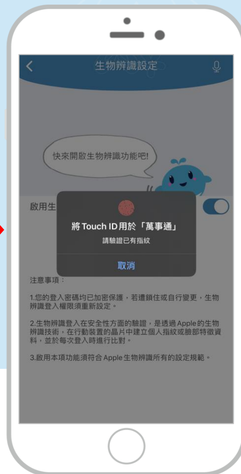
記得要先於裝置上 設定指紋或臉部辨識