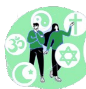
sua preferência religiosa

Agora fica fácil você compreender que o uso mal intencionado desses dados pode criar muitos problemas, como ocorre com os conhecidos golpes de boletos bancários, fraudes em contas de aplicativos, abertura indevida de contas bancárias e de consumo.