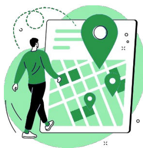
seus hábitos de deslocamento