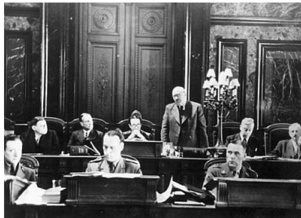
第15回国際刑事警察委員会総会

1946年、ブリュッセルにおいて第15回ICPC総会が開催され、本部をウィーンからパリに移してICPCの活動を再開することが決められた。また、新しく規約も取り決められ、ICPCを各国の代表である正会員と総会が選出する特別会員により構成すること、ICPCの事務局として国際中央事務局を常設すること、国際犯罪者に関する情報の提供、偽造犯罪に関する情報の収集・提供等の任務を行うことなどが定められた。