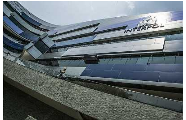
IGCI 外観