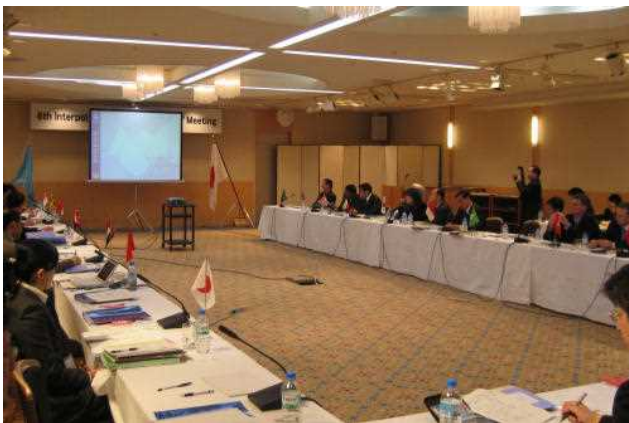
第6回アジア連絡調整官会議

1994年(平成6年)に開催された第13回アジア地域会議の勧告を受け、日常的に連絡調整を行う国家中央事務局の連絡調整官を集めた会議が1996年(平成8年)から開催されている。2007年(平成19年)には、第6回アジア連絡調整官会議が我が国で初めて開催され、アジア地域における国際的犯罪に対する取組を強化するための発表や討議が行われた。