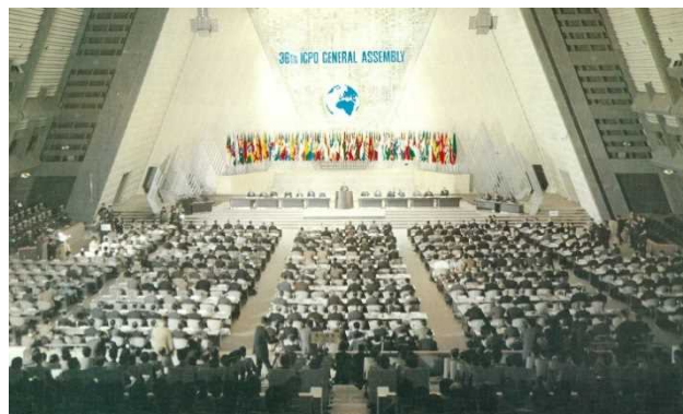
第36回インターポール総会（京都）

1967年（昭和42年）9月27日から10月4日までの間、第36回総会が京都において開催された。これは、アジアにおける最初の総会であった。この総会には、69か国（当時の加盟国数は98か国）の代表179人と関係国際機関のオブザーバー33人が参加した。