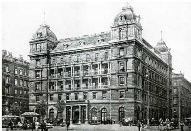
第2回国際刑事警察会議会場（ウィーン警察本部）

1923年、ウィーンにおいて第2回国際刑事警察会議が開かれ、20か国 (注) の警察の長が参加し、国際刑事警察委員会（ICPC-International Criminal Police Commission）の創設が決められた。