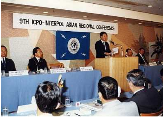
第9回アジア地域会議

上記の第36回総会に先立ち、1967年(昭和42年)9月25日及び26日に、京都において、第1回アジア地域会議が開催された。また、1987年(昭和62年)7月1日から4日までの間、東京において、第9回アジア地域会議が開催された。