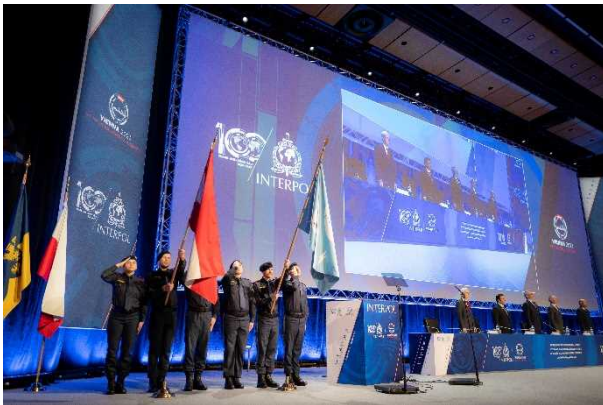
第91回インターポール総会（オーストリア）