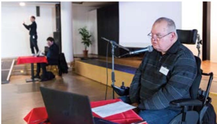
Seminár otvorené – ústretové – prístupné (kulturné inštitúcie na ceste k debariérizácii) NOC 2018