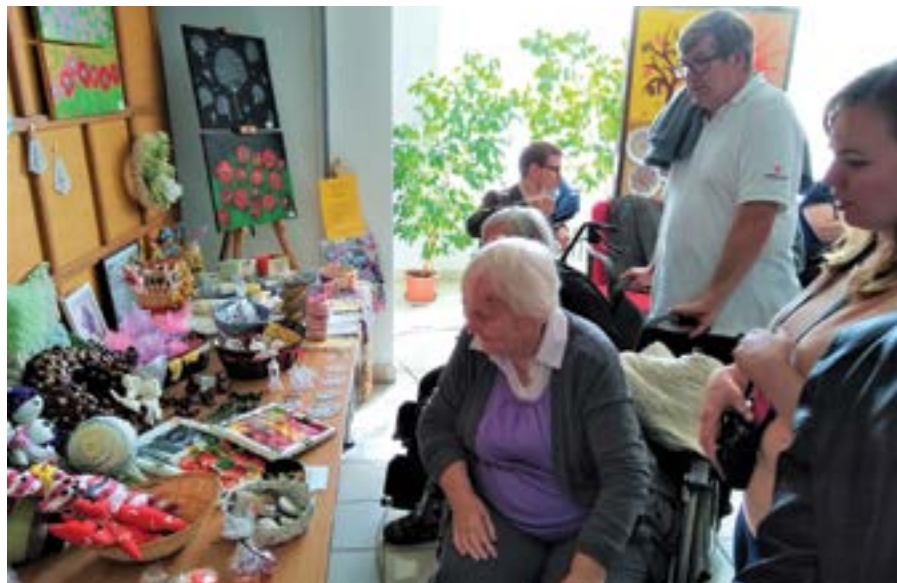
Výsledky tvorivých dielní

Ďalším priekopníckym projektom Spolku pracovníkov miestnej a regionálnej kultúry Slovenska v Galante, ktorým sa snaží venovať pozornosť znevýhodneným skupinám obyvateľstva, je projekt pod názvom Modrý sprievod – šírenie povedomia o autizme . Aj tento projekt sme uskutočnili vďaka finančnej podpore Ministerstva kultúry SR. V uplynulých rokoch sme v našom okrese zaregistrovali zvyšujúci sa počet narodených detí s mentálnym postihnutím a poruchou autistického