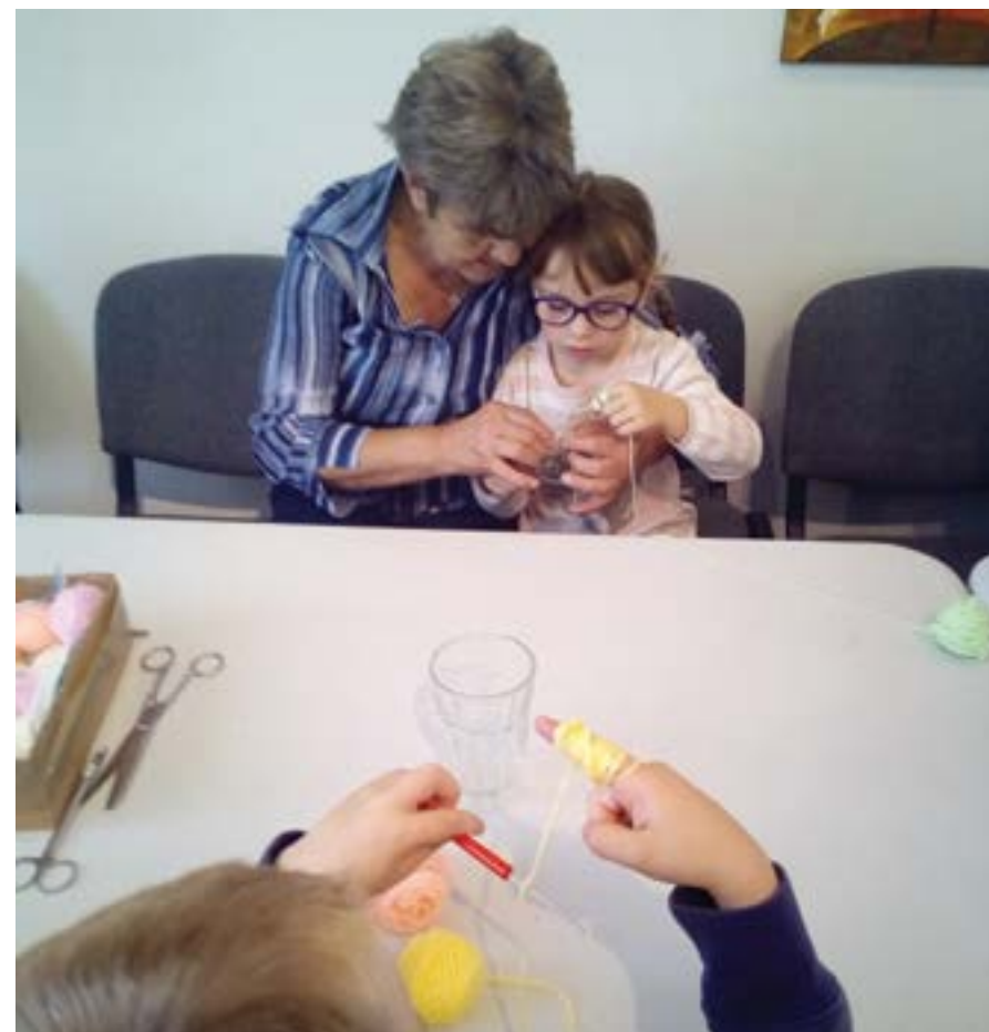
Spoločné tvorivé dielne

Náš projekt sa snaží súborom spoločenských, poznávacích a kultúrnych aktivít odpovedať na aktuálne a najvýraznejšie ohrozenia obyvateľov tretieho veku, ktorí žijú v meste Dolný Kubín a v blízkom okolí. Aktivity projektu sú pre nich ponukou a výzvou svoje potreby naplniť nenútenou a prirodzenou formou nielen v skupine podobných vekom, ale i v kontakte s inými – s deťmi, ktorým môžu odovzdať životné poslanstvo a motivovať ich i pri utváraní názorov, postojov a vzorov. Chceme nielen udržať fyzickú a psychickú vitalitu seniorov, ale ich aj včleniť do komunity lokálneho spoločenstva tak, aby sa cítili potrební, a tak, ako to bolo v minulosti prirodzené. Nástrojom na splnenie našich cieľov sa stala aktivizácia klubu ručných prác , v ktorom sa stretávajú šikovné ženy – seniorky. Tak sa nám darí pretaviť podnety a záujem seniorov vyjadrený na stretnutiach a pri realizácii iných aktivít do konkrétnej podoby. Takéto stretnutia predchádzali vlastnému projektu. Ženy tretieho veku na nich prejavili záujem