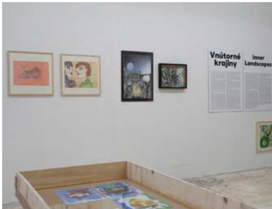
Výstava v Bratislave

Výstava sa uskutočnila v dvoch reprízach: v Galérii mesta Bratislavy (Pálffyho palác, Bratislava 15. 11. 2018 – 20. 1. 2019) a v galérii PARTER BSC (Banská Štiavnica 9. 11. 2019 – 14. 12. 2019). Dôležitým kritériom pri výbere výstavných priestorov bola ich relevancia v rámci súčasného umeleckého diania. Inými slovami, bolo pre nás dôležité prezentovať výsledky projektu v dôstojných galerijných priestoroch, v prostredí a kontexte „vysokého“ umenia, kam art brut patrí napriek tomu, že ide o neprofesionálnu tvorbu.