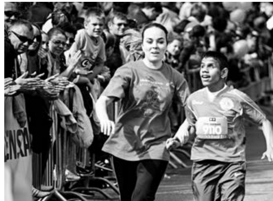
Vbehni do života – ocenená fotografia v súťaži Cesta svetla

Cesta svetla je súťaž otvorená pre každého bez obmedzenia – fotografov profesionálnych i amatérskych, vidiacich aj nevidiacich, ľudí akéhokoľvek veku. Jej cieľom je zvýšiť citlivosť spoločnosti k ľuďom so zrakovým postihnutím a akceptovať ich ako prirodzenú súčasť spoločnosti. A čo lepšie spája a búra zbytočné bariéry či mýty ako umenie? V tomto prípade umenie zachytené vo fotografii. Amatérski i profesionálni umelci akéhokoľvek veku sa už každoročne zapájajú do súťaže, ktorá má jedinou podmienku – umelecky zachytiť motív svetla alebo života so zrakovým postihnutím. Do súťaže sa pravidelne prihlasujú stovky fotografov s tým najlepším, čo sa im podarilo zachytiť hľadáčkikom fotoaparátu. Tí najúspešnejší, ktorých určila odborná porota, bývajú ocenení a ich snímky sú súčasťou spoločnej výstavy, nezriedka putujúcej po celom Slovensku. Najlepšie snímky sú zároveň zaradené do kalendára vydávaného Úniou nevidiacich a slabozrakých Slovenska.