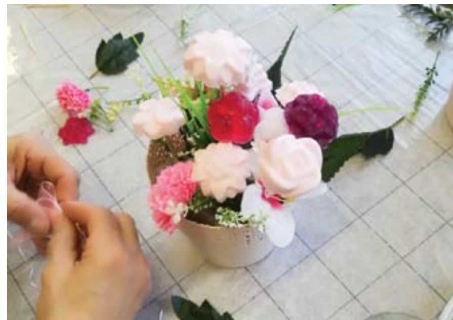
Výroba mydiel, mydlových kytičiek