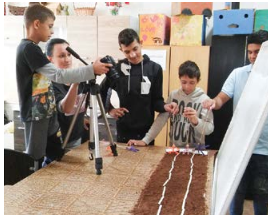
Tak to vidím ja

Veľmi pútavým a zaujímavým projektom pre deti zo sociálne znevýhodneného a výchovne menej podnetného prostredia bol projekt Takto vidím ja – sú to filmové tvorivé dielne. Tieto tvorivé dielne v rámci projektu zahŕňajú niekoľko fáz tvorenia – od námetu cez tvorenie „účinkujúcich“ a scén, výber pointy, hudby, sprievodných textov, resp. textových bubliniek až po špeciálne efekty. Takto na našich stretnutiach vznikajú krátke animované filmy, ktoré tvoria