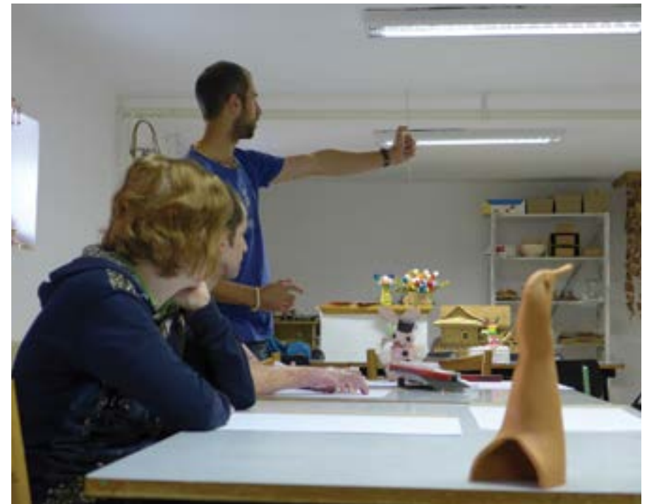
Osudy II – workshop

Výsledkom už prvých tvorivých stretnutí bola výstava výtvarných a fotografických prác, ktorá