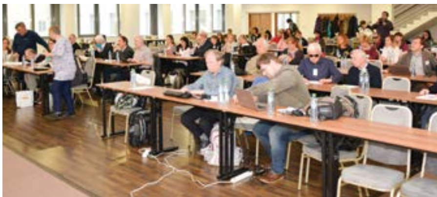
Konferencia 2018 o využití Braillovo písma v rámci kultúrnych podujatí