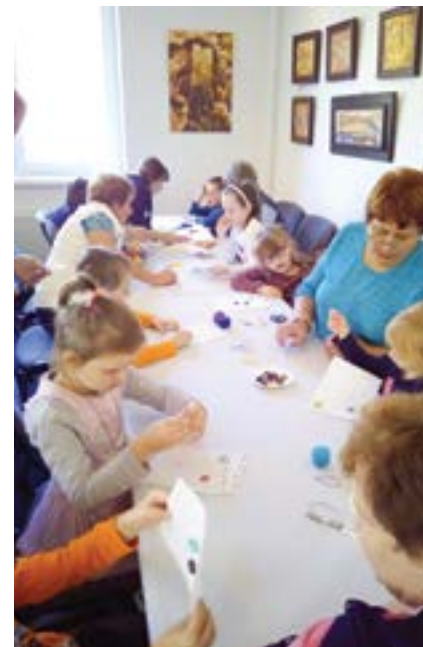
Stretnutie seniorov s deťmi