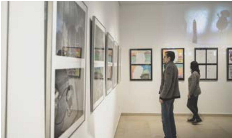
Osudy V – výstava v SNM v Martine

Snahou realizátorov v prvých ročníkoch tohto projektu bolo priamo priblížiť dostupnosť živej kultúry pre osoby so zdravotným postihnutím, napomôcť rozvoj ich kultúrnych potrieb. K tomu prispeli práve výtvarné a fotografické tvorivé dielne. Vzdelávací obsah cyklu umožnil účastníkom pomocou získaných vedomostí a aktívnej tvorby nájsť vhodný priestor na vlastné umelecké sebavyjadrenie pretavené do záverečných výstav.