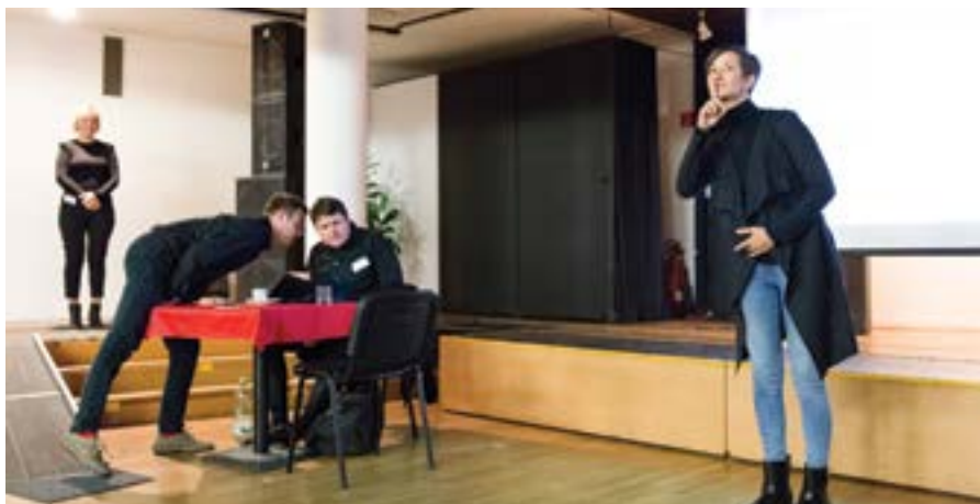
Umelecké tlmočenie do slovenského posunkového jazyka

V roku 2019 Národné osvetové centrum pokračovalo v realizácii aktivít s problematikou zdravotne postihnutých občanov seminárom Kultúra pre všetkých (Košice 14. júna 2019).