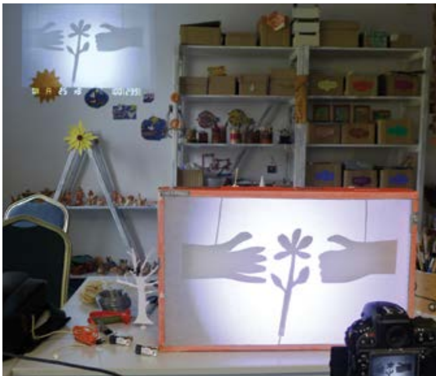
Osudy IV – Tieňohra

Ľudí, ktorí trpia psychickými ochoreniami a poruchami, stále pribúda. Naše duševné zdravie ohrozuje stres, rýchly životný štýl, prepracovanosť, náročné vzťahy v rodinách, sociálna neistota i nevyriešené traumy z minulosti. Máme pocit, že psychohygiena s dostatkom spánku a aktívneho odpočinku je luxus. Depresia, spojená s úzkosťou či inými prejavmi narušenia psychiky, ľudí často prekvapí. Mnohí majú pocit, že „im sa to nikdy nemôže stať“, a depresiu pokladajú za prejav slabosti či za vlastné osobné zlyhanie. Liečba u psychiatra je podľa mnohých „iba pre bláznov“ a duševné ochorenia sú u nás stále tabu.