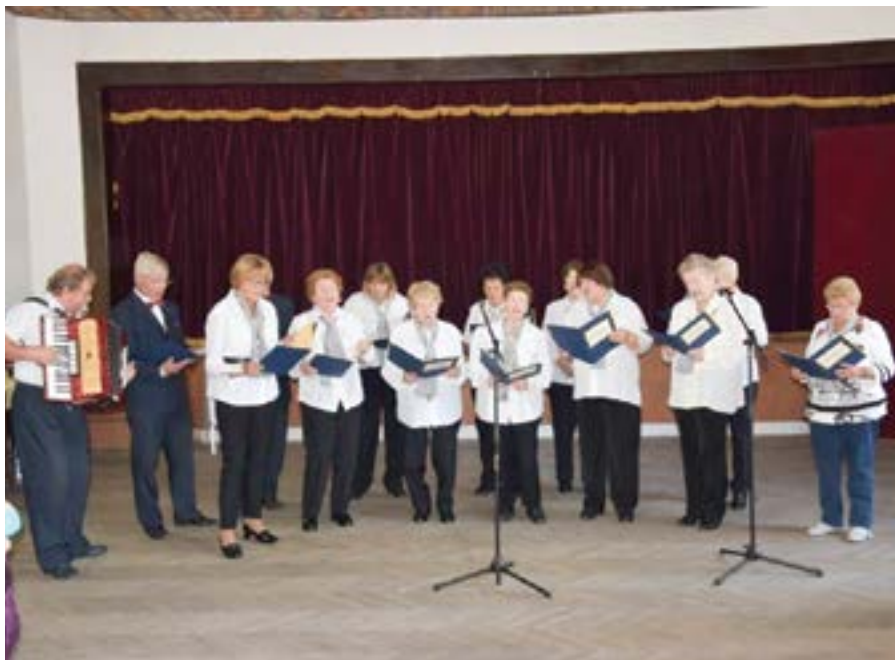
Na strieborných vlnách

Prehliadku Na strieborných vlnách, ako súčasť celého projektu, sme od samého začiatku realizovali v obci Rimavské Brezovo, kde sme našli úžasnú podporu zo strany obecnej samosprávy a vždy v mesiaci október, čo je Mesiac úcty k starším. Na prvom ročníku tejto prehliadky sa zúčastnili zástupcovia štyroch klubov v počte 42 osôb. Na zatiaľ poslednej prehliadke v roku 2019 sa zúčastnili zástupcovia 11 klubov dôchodcov a Jednoty dôchodcov v rámci regiónu v celkovom počte 142 osôb.