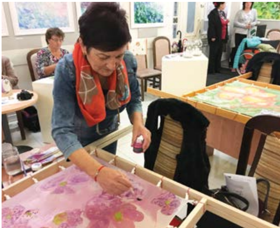
Maľovanie na hodváb

Kultúrne a osvetové zariadenia prinášajú širokú ponuku aktivít a podujatí pre rôzne skupiny ľudí, ktoré im umožnia objaviť a realizovať svoje tvorivé schopnosti a skrytý potenciál. Aj keď nie vždy ide o tvorivosť v zmysle vytvárania umeleckých diel, môže to byť uskutočňovanie drobných vecí alebo nepatrných činností, pri ktorých je potrebná predstavivosť. „Nikto nie je úplne neschopný . Každý dokáže aspoň niečo urobiť. Len mu treba na to vytvoriť podmienky.“ – Preiffer.