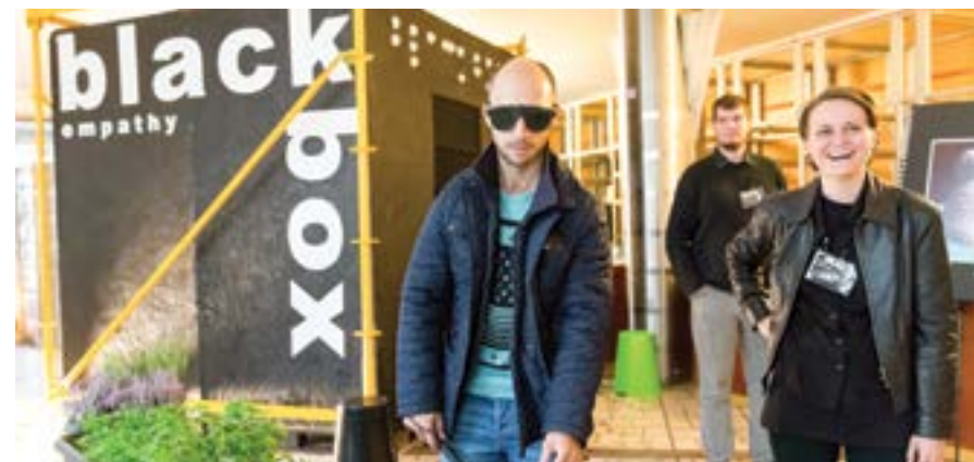
Interaktívna umelecká inštalácia (Black Box)