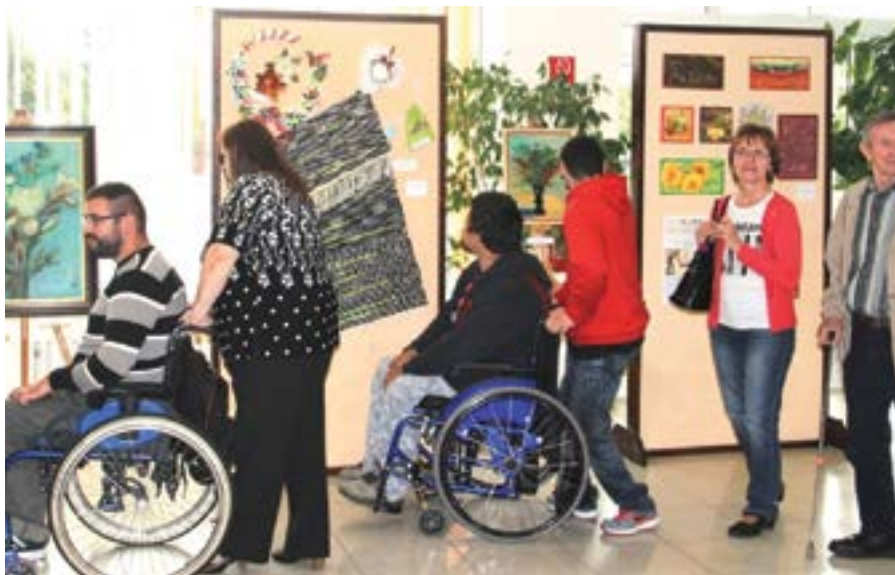
Výstava Kultúra bez bariér

V galantskom regióne žije pomerne veľa osôb so zdravotným postihnutím, ktoré sa venujú určitému druhu umenia. Mnohých zaujíma výtvarníctvo, ale venujú sa aj recitácii poézie a prózy, spevu, hre na hudobných nástrojoch či tancu. Všetky tieto krásne umelecké činnosti pomáhajú osobám s rôznym zdravotným postihnutím popasovať sa so zložitým životným osudom. Naše občianske združenie už vyše 10 rokov veľmi úspešne realizuje podujatia v rámci projektu s názvom Kultúra bez bariér , ktorými sa snaží zblížovať a zároveň vzájomnou interakciou obohacovať život znevýhodnených osôb žijúcich v spoločnom priestore so zdravými ľuďmi. Základným cieľom predmetného projektu je formou prezentácie tvorivých aktivít zdravotne postihnutých