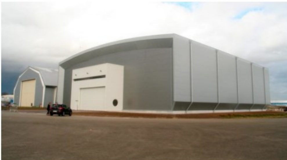
Le vaste bâtiment Jean-Paul Béchat est situé dans la zone technique de Dugny

C'est sous des trombes d'eau que le « totem » qui marque l'entrée du bâtiment a été dévoilé par un parterre d'officiels, le 23 novembre 2017 à 15 heures... Tout le monde s'est vite réfugié à l'intérieur du nouvel hangar "Jean-Paul Béchat" (3.500 m2) dédié aux réserves du musée de l'air et de l'espace du Bourget !