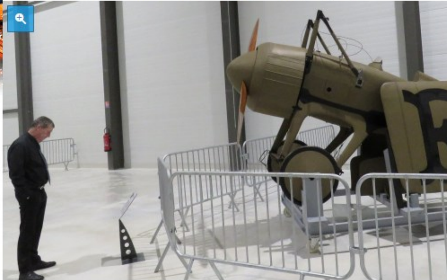
Un Deperdussin Monocoque, un avion de course construit au début du XIXe siècle, présenté jeudi 23 novembre, lors de l'inauguration de la réserve du musée de l'air et de l'espace du Bourget, située sur le territoire voisin de Dugny.