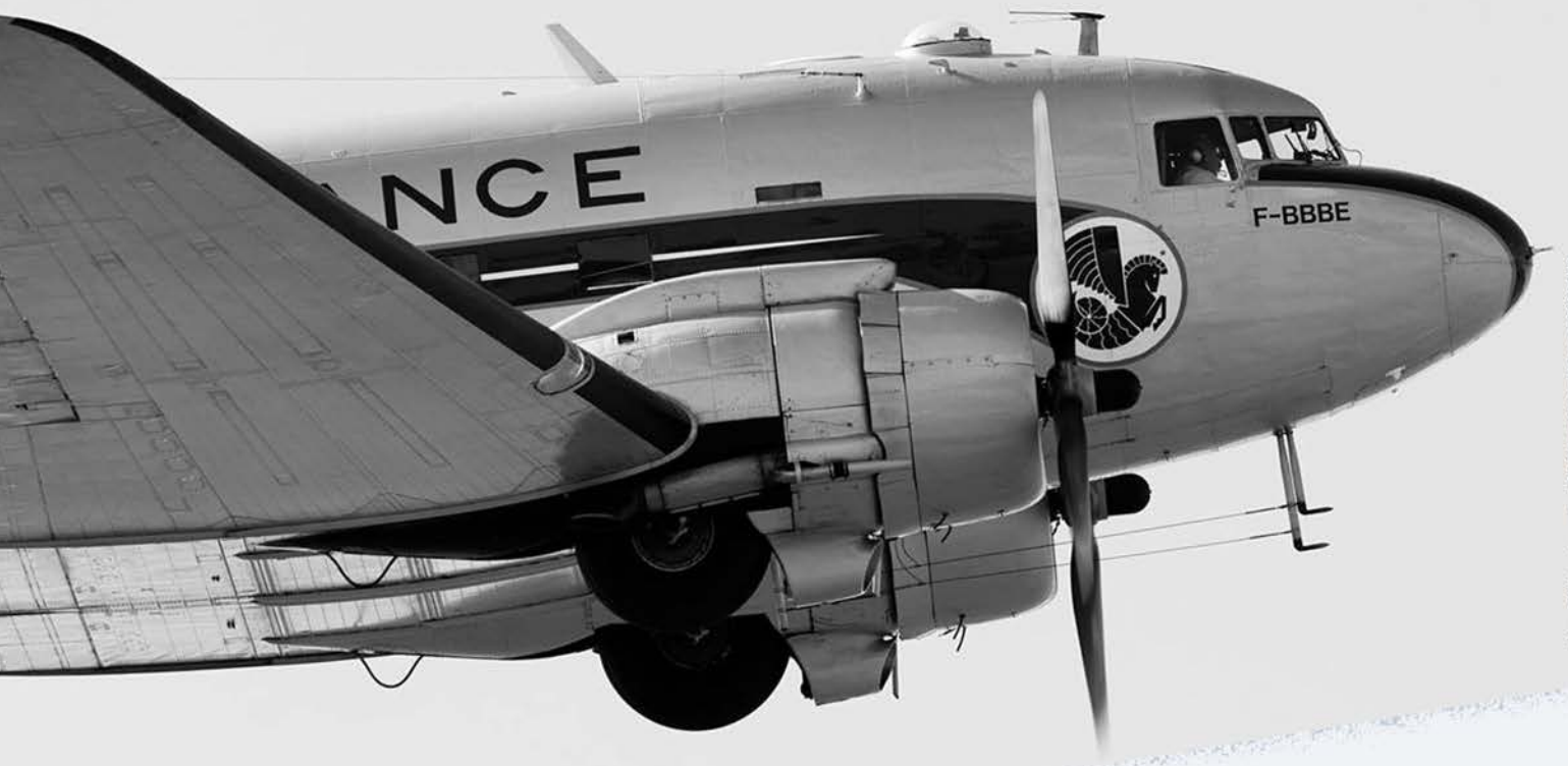
© Jean-Philippe Lemaire - DC-3, Association France DC-3 (Orly)