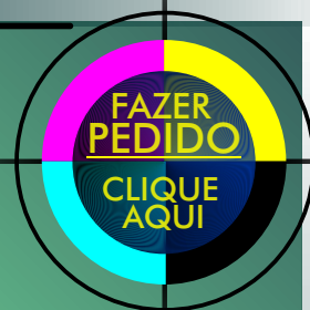
GRÁFICO da MARINHA