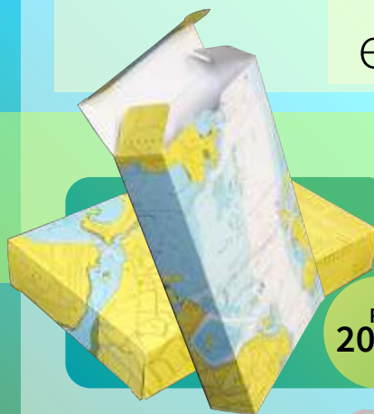
CAIXA PORTA LIVRO