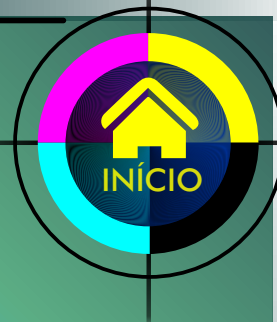
GRÁFICO da MARINHA