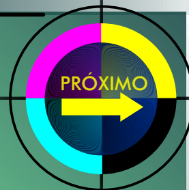
GRÁFICO da MARINHA