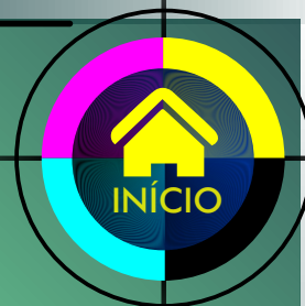
TABELA - OUTROS