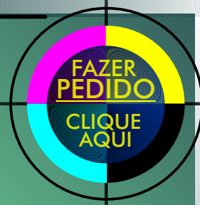
GRÁFICO da MARINHA