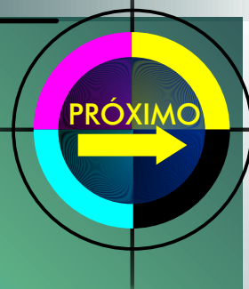
GRÁFICO da MARINHA