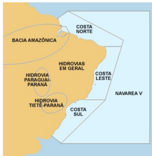
Figura nº 2 - NAVAREA V

A NAVAREA V possui uma área aproximada de 10 milhões de Km 2 .