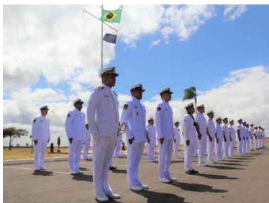
Militares da ERMB em formatura

A premiação foi realizada em visita do Secretário da RNIT, Capitão de Fragata Craig Thomas McLemore, à ERMB, no dia 21 de julho de 2023. Essa foi a 15ª conquista da ERMB – também agraciada em 1997, 2000, 2003, 2004, 2005, 2006, 2007, 2011, 2012, 2014, 2015, 2016, 2017 e 2018.