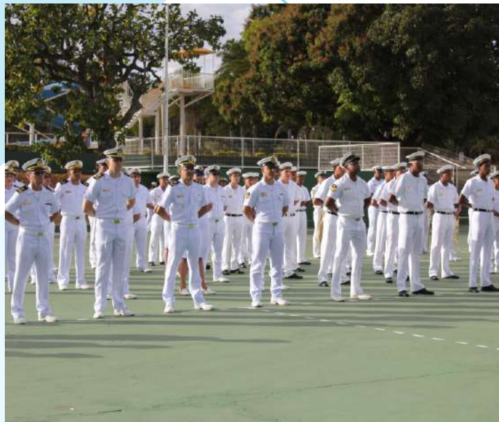
Militares do Com7ºdn e OM subordinadas

No dia 24 de julho, militares do Comando do 7º Distrito Naval e Organizações Militares Subordinadas participaram da Cerimônia em Homenagem à Memória dos Mortos da Marinha em Guerra. O evento foi realizado no Clube Naval de Brasília, e contou com a presença de oficiais gerais da Marinha em Brasília, de representantes da Associação de veteranos do Corpo de Fuzileiros de Brasília e da SOAMAR-DF.