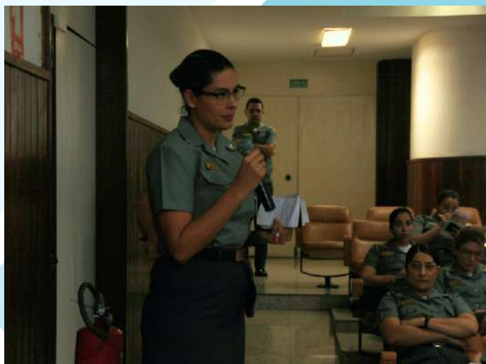
Momento de perguntas e respostas

O encontro teve participação das militares no momento do debate, que reforçaram a condição de referência atingida pela Almirante Maria Cecília, não apenas por sua competência demonstrada ao longo da carreira, mas também por ser a terceira mulher da Força a ser promovida a oficial-general e primeira negra a ascender ao posto de Almirante.