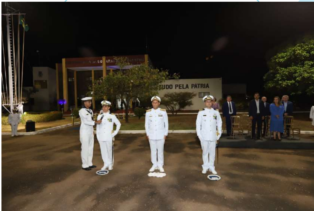
Transmissão de cargo na Capitania Fluvial do Araguaia-Tocantins

A Capitania Fluvial do Araguaia-Tocantins (CFAT) realizou, no dia 31 de julho, a transmissão do Cargo de Capitão dos Portos do Araguaia - Tocantins, em Palmas. A cerimônia foi presidida pelo Comandante do 7º Distrito Naval, Vice-Almirante José Vicente de Alvarenga Filho, e contou com a presença do Governador do Estado do Tocantins, Wanderlei Barbosa, e de outras autoridades.