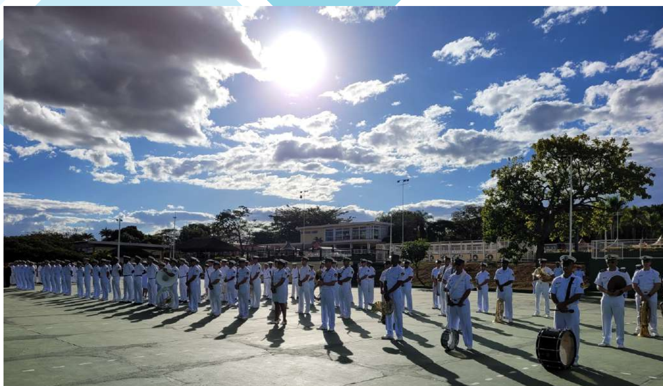
A cerimônia ocorreu no Clube Naval de Brasília

Na solenidade, foi feita a leitura da Ordem do Dia do Comandante da Marinha alusiva à data, a qual encorajava os militares a seguir firmes em frente aos desafios: “Honrem os feitos daqueles que, no passado, padeceram nas contendas em que o País tomou parte. As memórias desses valorosos heróis, além de inspiração, servem-nos de força motriz para seguirmos, juntos, em navegação venturosa, rumo a manter uma Marinha moderna, aprestada e motivada.”