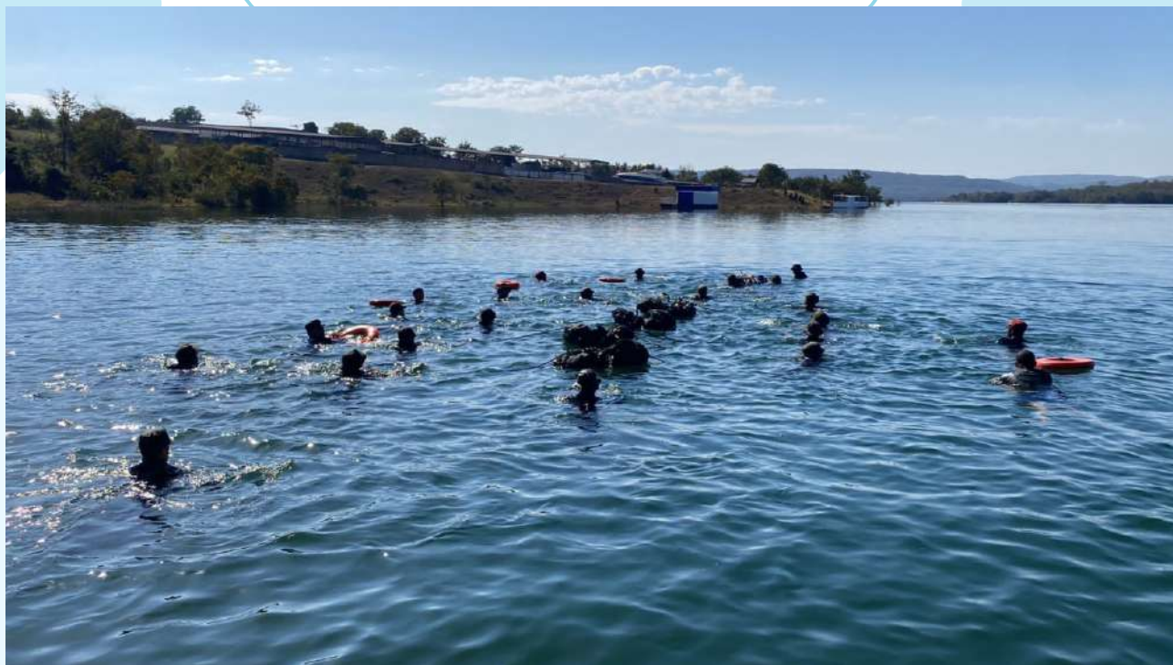
Capacitação proporcionou contato com ambiente Ribeirinho e com bioma cerrado

O GR é composto por todo o pessoal do detalhe de serviço, além dos militares que se encontrarem a bordo por ocasião de seu acionamento. Sua tarefa é promover uma oposição imediata e eficaz, com o propósito de repelir qualquer ação adversa e inopinada contra a instalação.