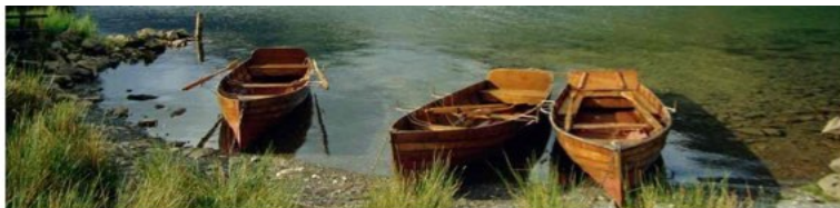
Rural peace: the Lake District.