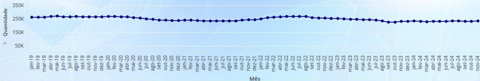
Evolução do acervo de processos em contencioso administrativo de 1ª instância (valor total em bilhões de R$)