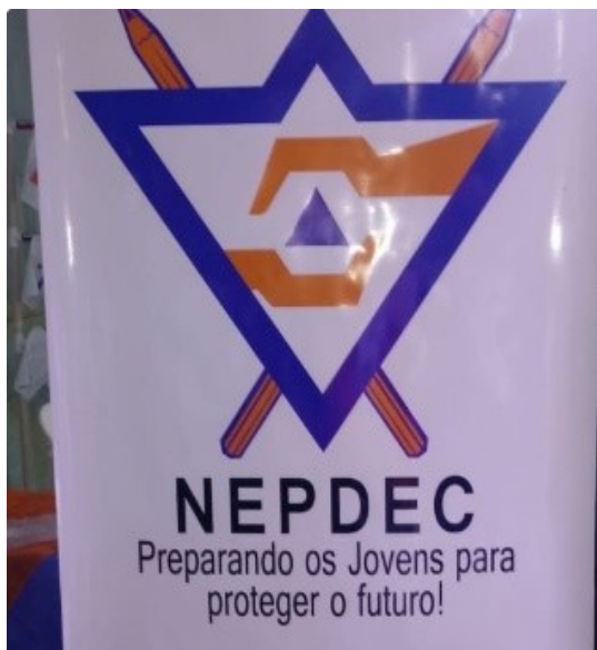
Campanha de Donativos realizada pela Presidente do NEPDEC de Balneário Rincão, em seu período de férias, para auxiliar a população atingida pela inundação ocorrida na Bahia, 2021.