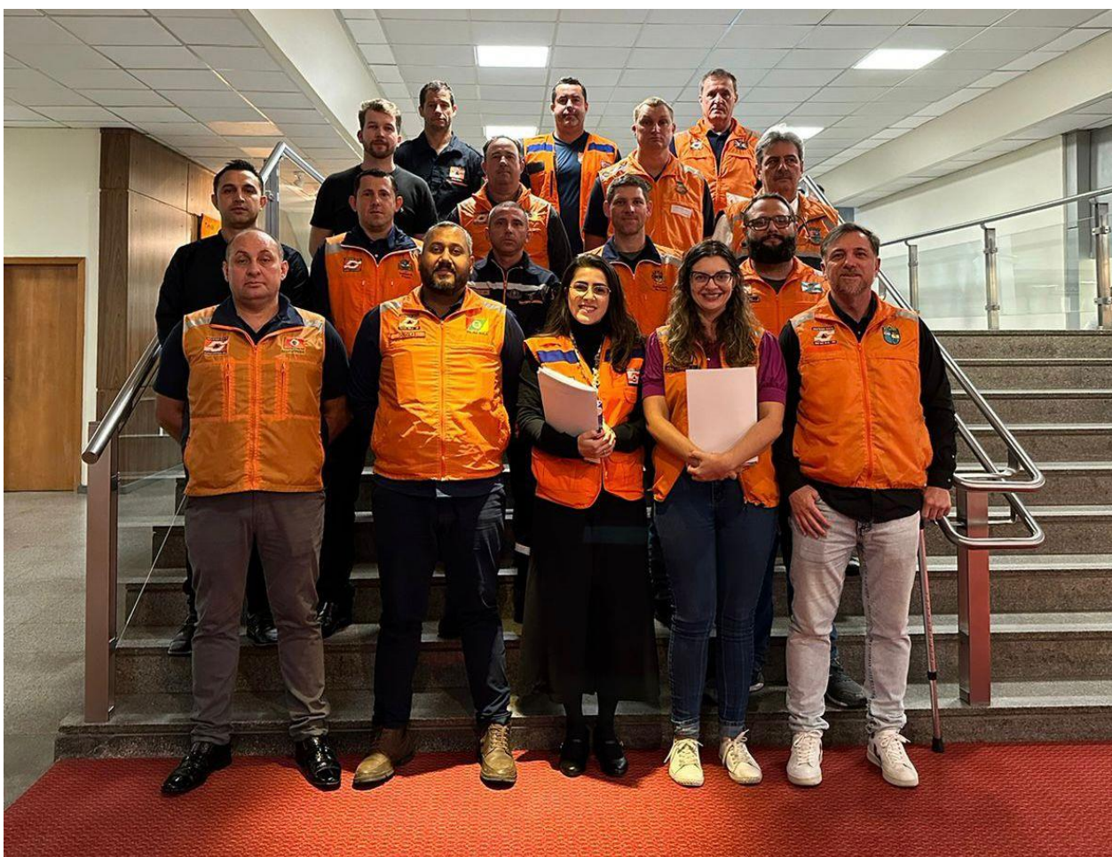
Mobilização do Colegiado de Proteção de Defesa Civil na Assembleia Legislativa de Santa Catarina (20 e 21/06/2023)