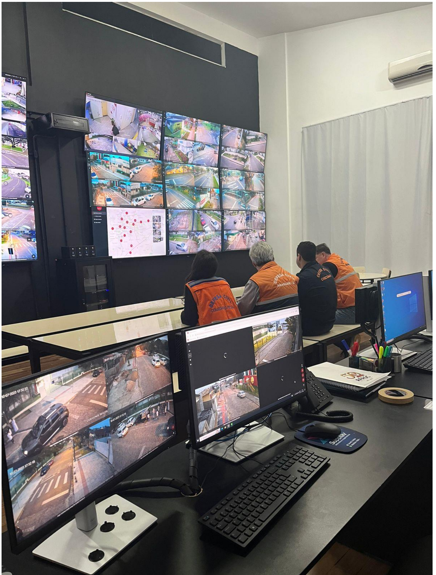
Visita ao Centro de Controle e Operações do município de Criciúma/SC (10/07/2023)