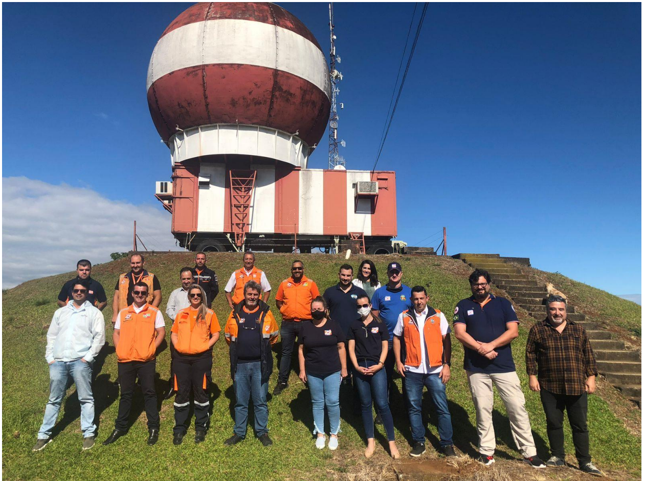
Visita ao radar meteorológico de Fraiburgo/SC (07/12/2021)