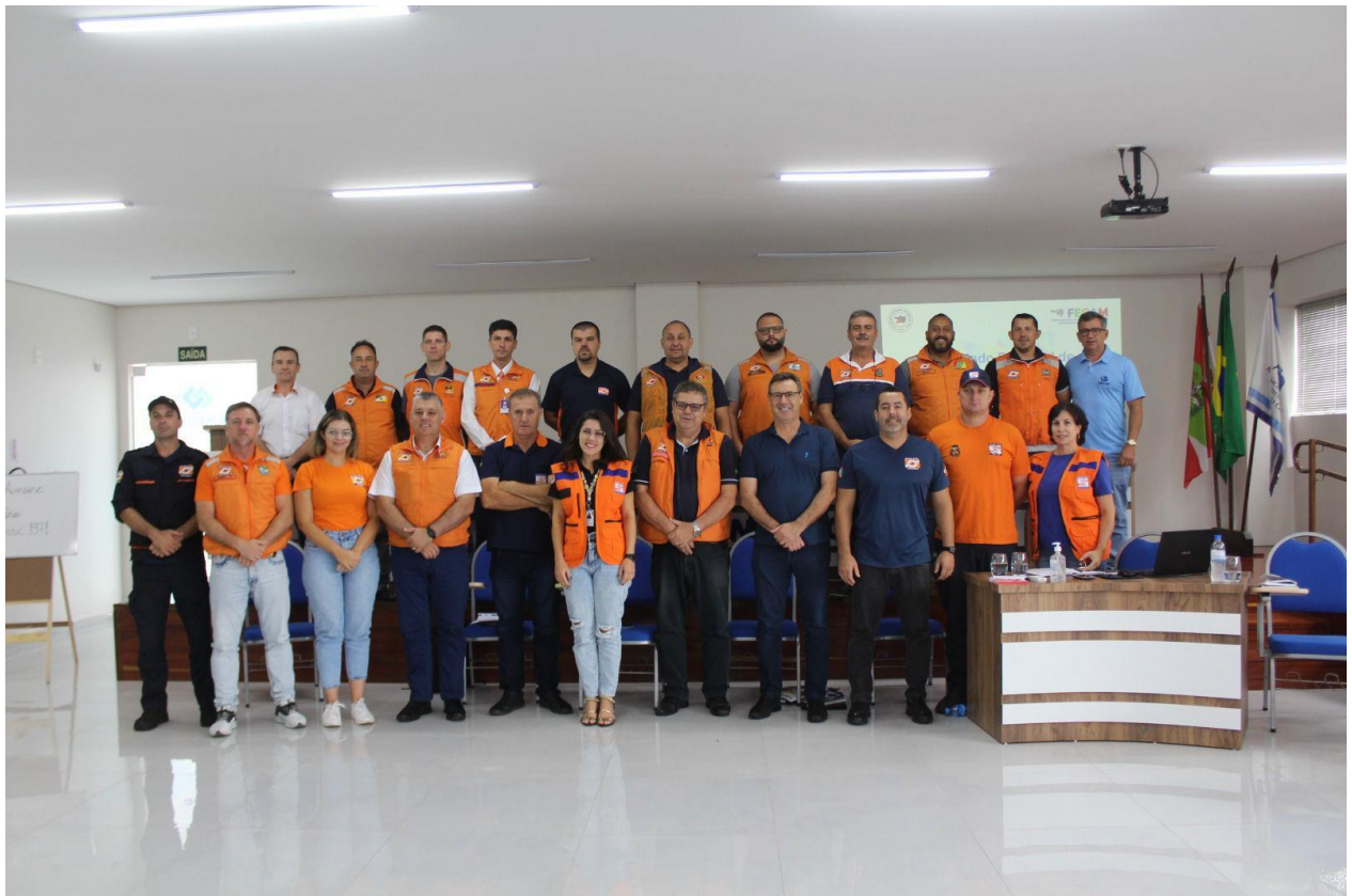
Reunião Ordinária do Colegiado de Defesa Civil em São Miguel do Oeste/SC (14/02/2023)