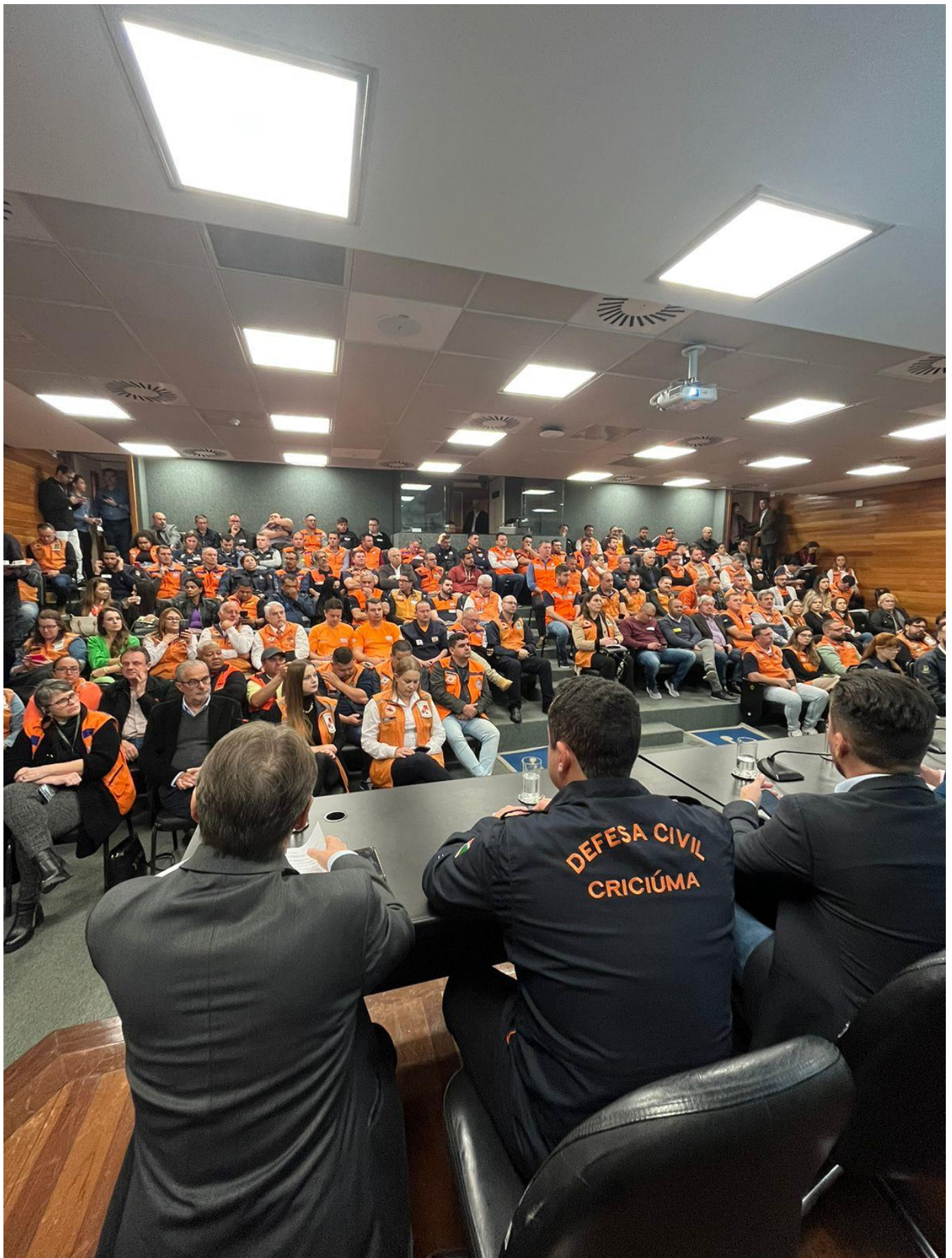
Participação em audiência pública na Assembleia Legislativa de Santa Catarina (09/08/2023)