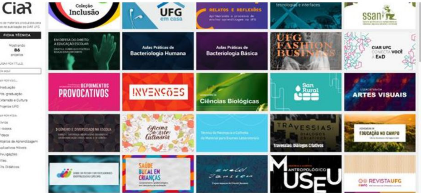
Figura 1 - Acervo de materiais do Ciar/UFG https://publica.ciar.ufg.br/