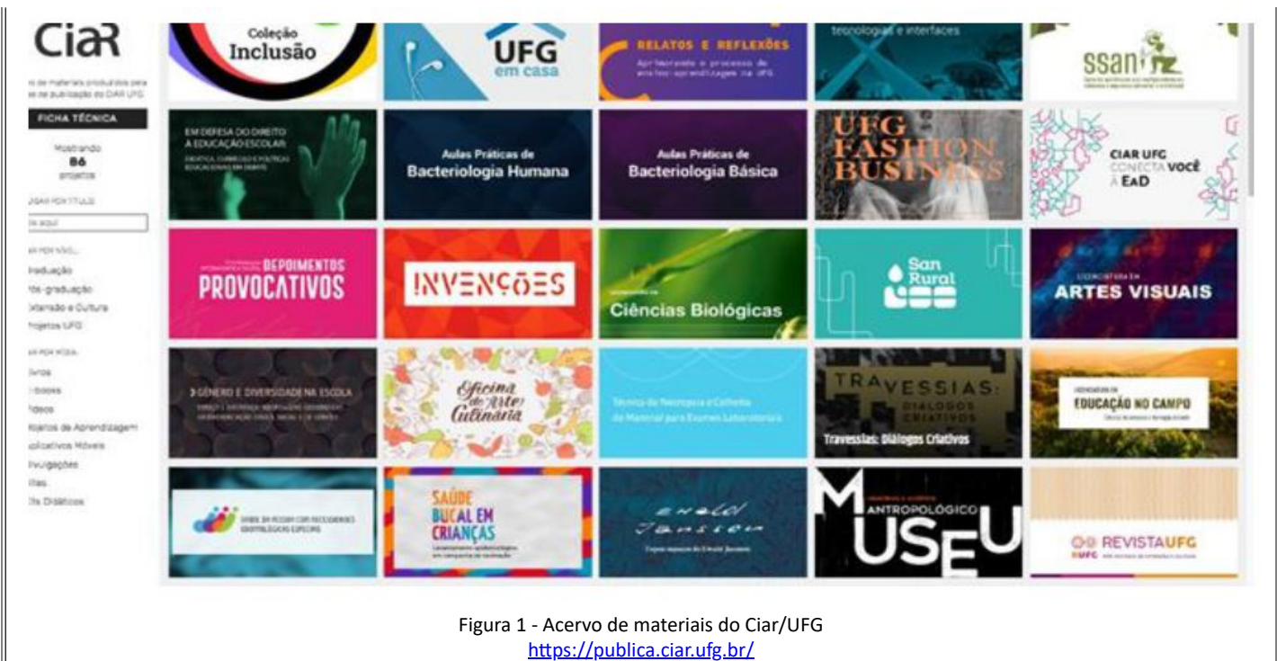
Figura 1 - Acervo de materiais do Ciar/UFG https://publica.ciar.ufg.br/