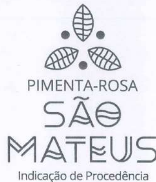
Figura 02 - Signo distintivo da IG a ser aplicado para os padrões de comercialização.

A representação gráfica e figurativa da Indicação de Procedência SÃO MATEUS para a Pimenta Rosa, com distintivo gráfico do tipo misto, de titularidade dos produtores estabelecidos no território delimitado e coordenada pelo Conselho Regulador da NATIVA está assim definida: