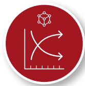
Fig. 15 La competitividad de México en Norteamérica

Es fundamental que nuestros expertos y gremio estemos comprometidos para participar.