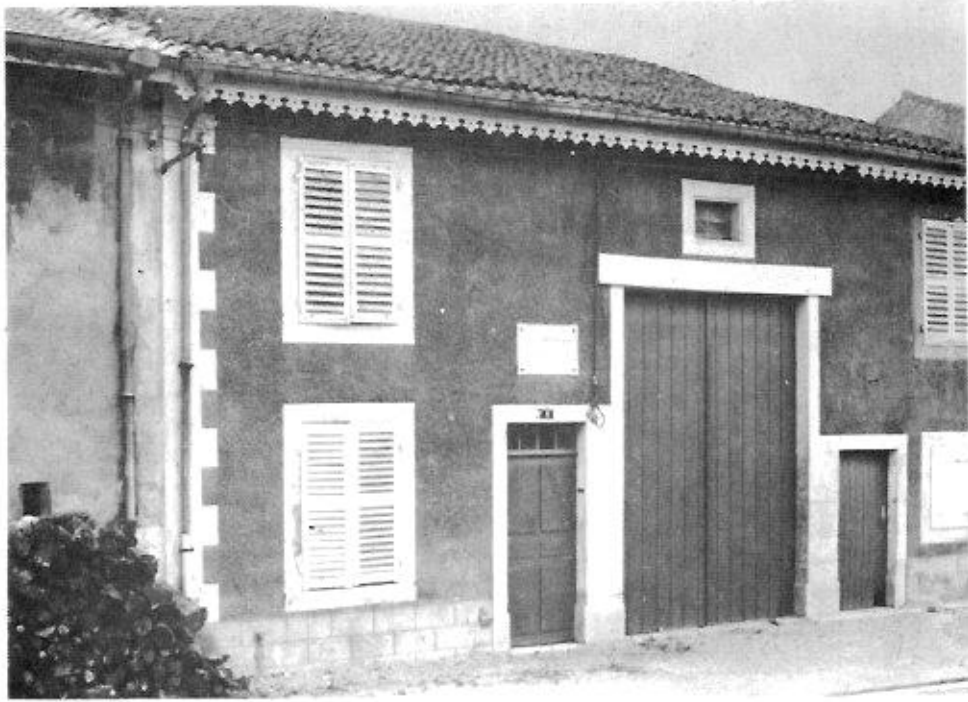
La maison d'E. MOSELLY à CHAUDENEY - Moselle (Canton Toul-Sud)