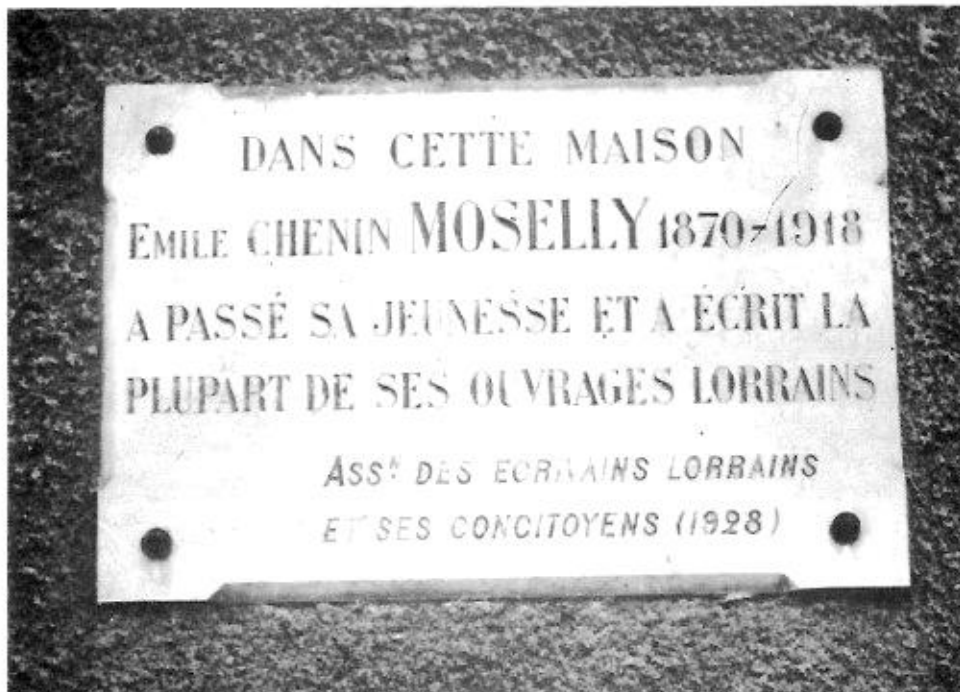
Plaque commémorative