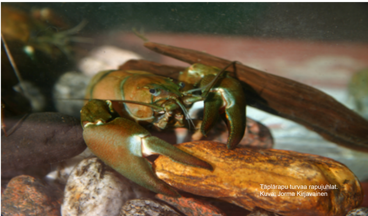
Täplärapu turvaa rapujuhlia.

Jos ja kun ministeriön kiireiset viskaalit antavat siunauksen kansalliselle rapustrategialle 2023–2032, se löytyy täältä: https://julkaisut.valtioneuvosto.fi/han/le/10024/161511