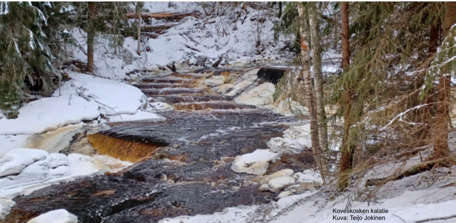
Koveskosken kalatie