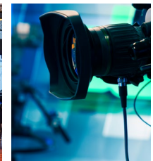
メディアおよびエンターテインメント