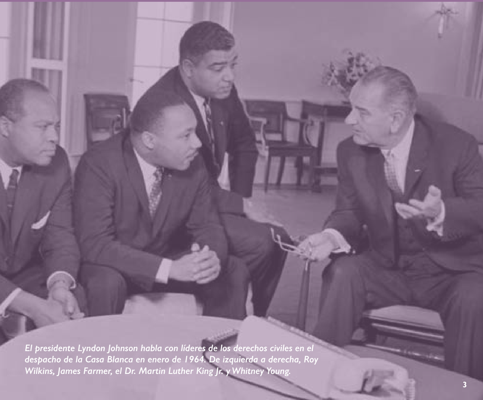
El presidente Lyndon Johnson habla con líderes de los derechos civiles en el despacho de la Casa Blanca en enero de 1964. De izquierda a derecha, Roy Wilkins, James Farmer, el Dr. Martin Luther King Jr. y Whitney Young.