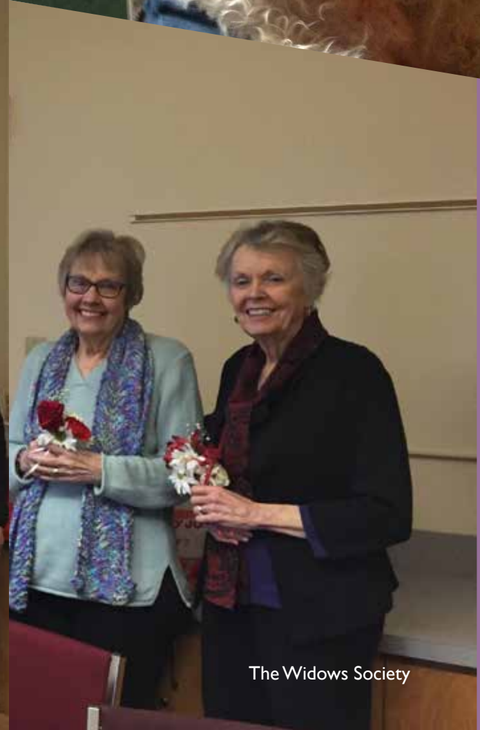
The Widows Society