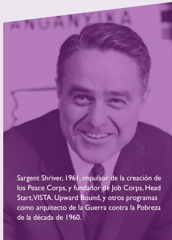
Sargento Shriver, 1961, impulsor de la creación de los Peace Corps, y fundador de Job Corps, Head Start, VISTA. Upward Bound, y otros programas como arquitecto de la Guerra contra la Pobreza de la década de 1960.

“La Acción Comunitaria, como su nombre indica, es una acción local. Dependemos completamente de las comunidades locales para que acudan a Washington con sus propios programas de lucha contra la pobreza de la forma que consideren más adecuada para hacerlo en su propia ciudad.” Sargento Shriver