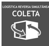
Imagem da Logo que compõe o Rótulo de Endereçamento da Logística Reversa Simultânea com Coleta

Obs: Informações do Data Matrix consta do Anexo 02 deste documento.