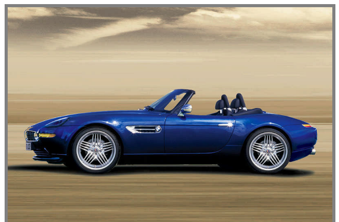
Alpina Roadster V8