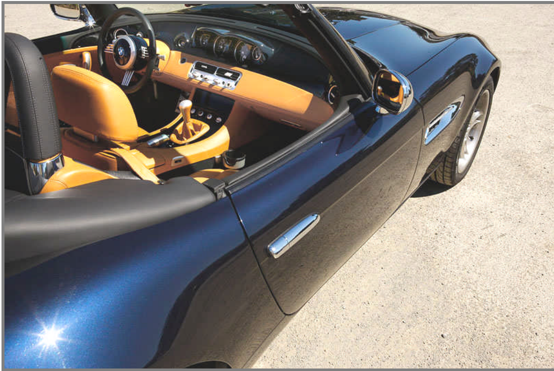
Einer von vier Individual BMW Z8 für Kanada in Mitternachtsblau / Leder Arizona Sun One of only four BMW Z8 Individual Midnight Blue Metallic / Arizona Sun made for Canada.