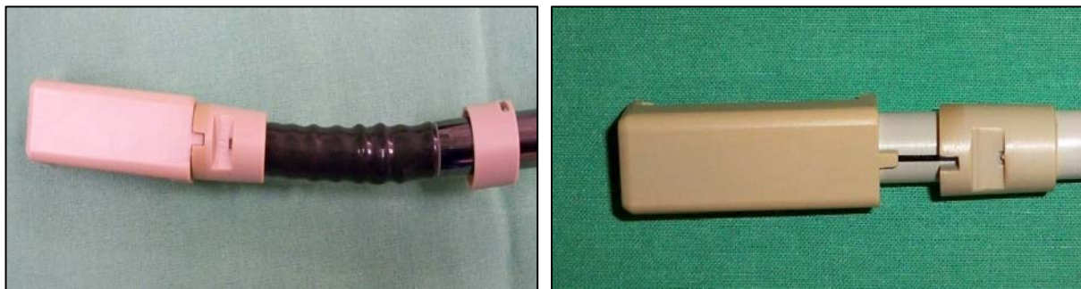
Abb. 2. Anbringung der Ringadapter mit einem Positionsteil bei Toshiba (links) und Philips (rechts)

Für die Anbringung des Adapters bzw. des Sensors an der BK Medical Sonde (Abb.1a) wird die schräge Biopsieführung in der Sonde genutzt. Der Adapter wird auf der oberen Seite positioniert und ist genau an die zylindrisch-konische Aussenfläche der Sonde angepasst. Die Befestigung selbst wird mit einer Titanschraubenverbindung erreicht. Für die Schraubenbefestigung wird ein speziell dafür entworfener und konstruierter Schraubendreher verwendet. Der Schraubendreher wurde aus sterilisierbarem Material angefertigt und darf in steriler chirurgischer Umgebung eingesetzt werden. Der Sensor wird mithilfe einer polungssicheren Hülse mit dem Adapter verbunden. Diese Lösung ermöglicht eine reproduzierbare Sensorbefestigung, die uns eine Kalibrierung vor der OP und in Laborbedingungen ermöglicht. Bei den anderen abgebildeten Sonden werden zur Sensorbefestigung verschiedene Verbindungen aus zwei Ringen verwendet (Abb.1b, c, d). Der Innenring ist an die Sondenoberfläche und –form genau angepasst und wird mit einem zweiten Außenring befestigt. Dank einer Positionierhilfe, die an die Spitze der US Sonde exakt angepasst ist, lässt sich der Ring über eine Nut-Zapfen Verbindung zwischen dem Positionsteil und dem Ring reproduzierbar positionieren und befestigen (Abb. 2). Der Sensor wird auch in diesem Fall mithilfe einer polungssicheren Hülse mit dem Ring verbunden.