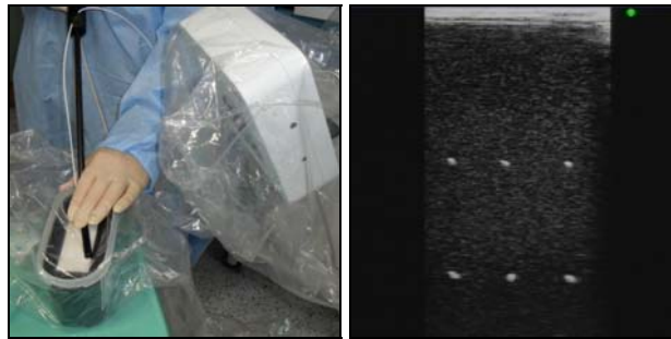
Abb.4. US – Kalibrierkörper und Anwendung im sterilen Überzug (links). Darstellung der Kalibrierfäden im US-Bild (rechts).

Die folgenden Abb. 4 und 5 zeigen die Anwendungen der beiden Kalibrierkörper in der sterilen Umgebung.