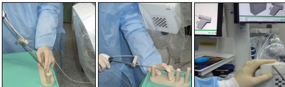
Abb. 5. Instrumenten-Kalibrierkörper. Kalibrierung eines Ultracision-Dissektors: Pivottierung der Instrumentenspitze (links). Rotation des Instrumentenschaftes (Mitte) und mit neuem Kalibrierkörper (rechts).