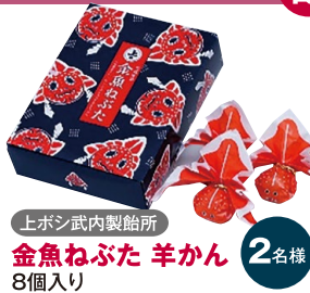
上ボシ武内製菓所 金魚ねぶた 羊かん 2名様 8個入り