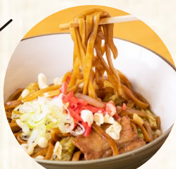
B級グルメの黒石つゆ やきそばは絶品です!