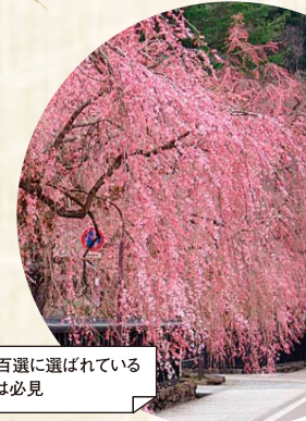
桜の名所百選に選ばれている角館の桜は必見