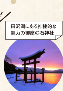
田沢湖にある神秘的な魅力の御座の石神社