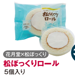
花月堂×松ぼっくり 松ぼっくりロール 5個入り