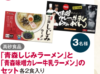
高砂食品 「青森しじみラーメン」と 「青森味噌カレー牛乳ラーメン」の セット 各2食入り

読者の皆さまへ抽選で プレゼントいたします。 この冊子の感想とともに ぜひご応募ください。