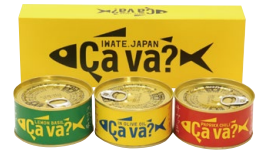
岩手缶詰株式会社 サヴァ缶 3個セット

読者の皆さまへ抽選で プレゼントいたします。 この冊子の感想とともに ぜひご応募ください。