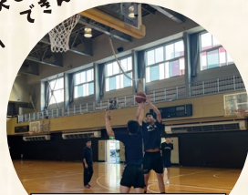
毎年強豪を招いて開かれる 「能代カップ」も必見!!