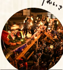
9月には「やまぶっつけ」が有名な角館のお祭りも開催