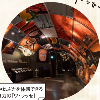
年中ねぶたを体感できる 迫力の「ワ・ラッセ」