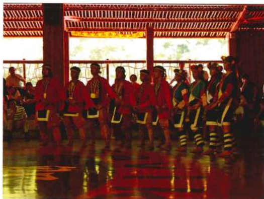
鄒族的歌