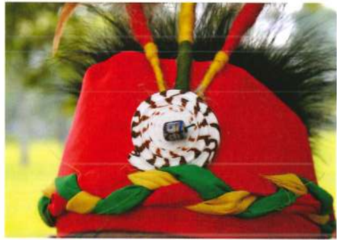
原住民族小朋友的頭飾

92 年頒布「國民中小學九年一貫課程綱要」，其中選修課程類別提到「國小 1 年級至 6 年級學生，應就閩南語、客家語、原住民族語等 3 種本土語言任選 1 種修習，國中則依學生意願自由選擇修習。」自此本土語言已列入語文領域，並占「語文學習領域」