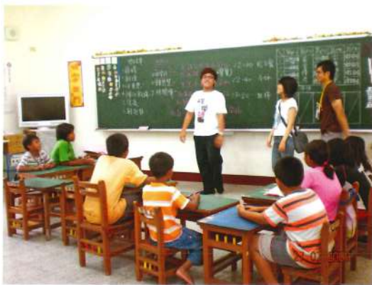
原住民大專生至偏遠國小暑期輔導