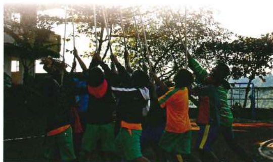
排灣族刺球活動

本白皮書之架構以緒論（第一章）為前導說明，以國民（含學前）教育、高中職教育、高等教育、師資培育、終身及家庭教育、民族教育等教育階段及類別分節論述原住民族教育之實施內涵，說明原住民族教育現況（第二章），分析原住民族教育問題（第三章），進而提出解決問題之發展策略（第四章），並展望原住民族教育願景（第五章）。