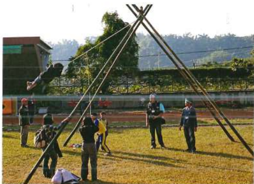
原住民盪鞦韆遊戲