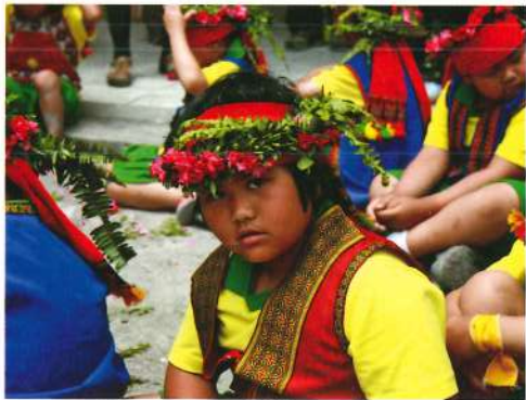
魯凱族小朋友