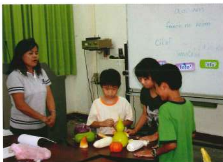
學習原住民族語