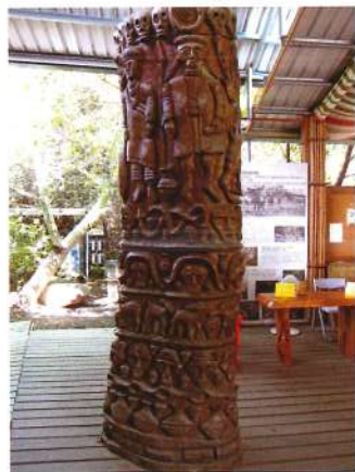
原住民族藝術雕刻

學校中的民族文化教育課程在開課時多以考慮能否聘請到講師、有無申請到補助計畫，或是學校發展的特色是什麼，所以，各年度所開之課程常有不連貫之情形，例如今年學習舞蹈、明年學習編織，很難提供給學生完整且深入的民族文化。又各縣市原住民族部落大學各年度開設連貫性的課程也不多，例如開設文化課程中的美食課程或編織課程，最多只開設一學期，少數會開到二學期的課程。每一種知識或能力的習得，若欲達到精熟程度，勢必需經長時間的訓練，但細察學校或部落大學的民族教育課程之開設均缺少系統性的規劃，對民族文化的復振就不易落實。