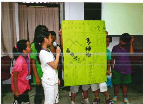
原住民小朋友了解大自然對環境的重要性