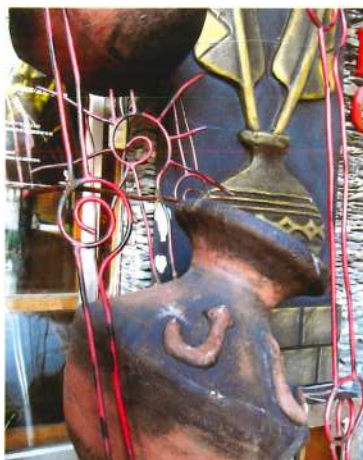
原味裝飾

100 學年度第 2 學期原住民族大專校院學生休學人數 1,970 人 (男生 966 人、女生 1,004 人)，休學率為 8.87%；一般生休學人數 88,602 人 (男生 52,240 人、女生 36,362 人)，休學率為 6.66%，原住民族學生休學率高於一般學生 2.21 個百分點 (表 14)。