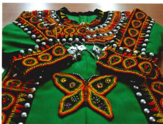
排灣族傳統服飾

展望未來，原住民族教育努力之方向，應繼續強化各族群的自我認同感，增進自我策劃與增能，促進族群實質公平機會，並平等對待族群之差異。促進多元族群間之互信與互助，尊重不同文化之內容。展現不同民族文化形態，並接納其他族群之特質，以實現共同合作創造美好國家形象，及增進族群競爭力之理想與願景。