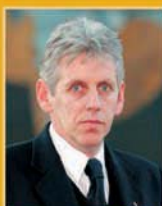
Guðmundur Baldvinsson útfararþjónusta