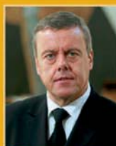
Þorsteinn Elísson útfararþjónusta