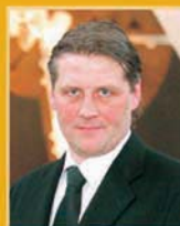
Svafar Magnússon útfararþjónusta