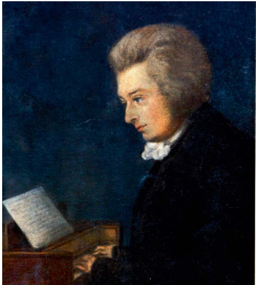
Þekktasta mynd sem til er af Wolfgang var gerð af svila hans, Joseph Lange (1751-1831) sem var leikari og myndlistarmaður. Þessi mynd er ýmist talin hafa verið gerð 1783 eða 1789. Myndin, sem er ekki fullgerð sýnir Wolfgang sitja við hljóðæfæri, en vitað er að Konstönsu þótti þetta vera besta mynd sem til væri af honum.

Áætlað er að Wolfgang hafi á síðustu fjórum árum ævi sinnar fengið um 11.000 gulden í tekjur og lán. Þann 7. desember 1787 veitti Jósef II Wolfgang stöðu sem „Kammer-Kompositeur“ við hirðina og fékk hann fyrir það 800 gulden í árslaun. Fastar tekjur hans á þessu tímabili voru því um 2.400 gulden á ári. Meðalkostnaður á þessum tíma fyrir fjölskyldu í Vínarborg var áætlaður um 600 -1.000 gulden á ári þannig að hann virðist hafa eytt miklu umfram það. Ferðalöggin voru dýr, hann fór m.a. til Frankfurt am Main á eigin kostnað árið 1790 til að vera við krýningu Leopolds II sem keisara í