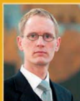
Frímánn Andrésón útfararþjónusta