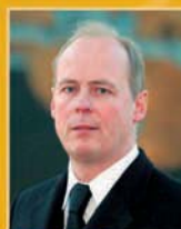
Ellert Ingason útfararþjónusta