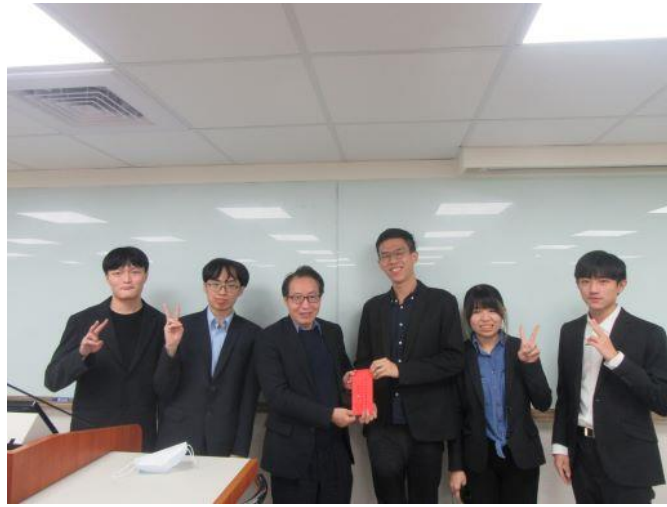
【臺北大學 榮獲分組報告競賽第一名】