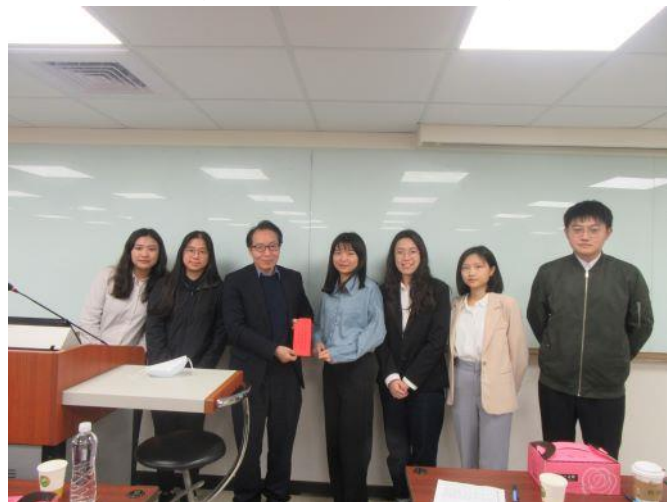
【臺北大學 獲分組報告競賽第三名】