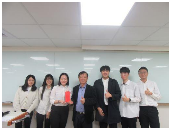
【淡江大學 同獲分組報告競賽第一名】