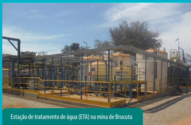
Estação de tratamento de água (ETA) na mina de Brucutu

Nossas medidas de controle são feitas por meio de estações de tratamento/clarificação de água e efluentes, recuperação de áreas, revegetação, preservação de nascentes, limpeza e criação/manutenção de diques para contenção de sedimentos, entre outras iniciativas.