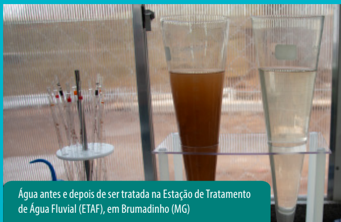
Água antes e depois de ser tratada na Estação de Tratamento de Água Fluvial (ETAf), em Brumadinho (MG)

“ A Vale está escrevendo um novo capítulo de sua história. Seguimos focados em transformar o futuro por meio do desenvolvimento socioeconômico das regiões onde operamos, gerando um legado positivo.