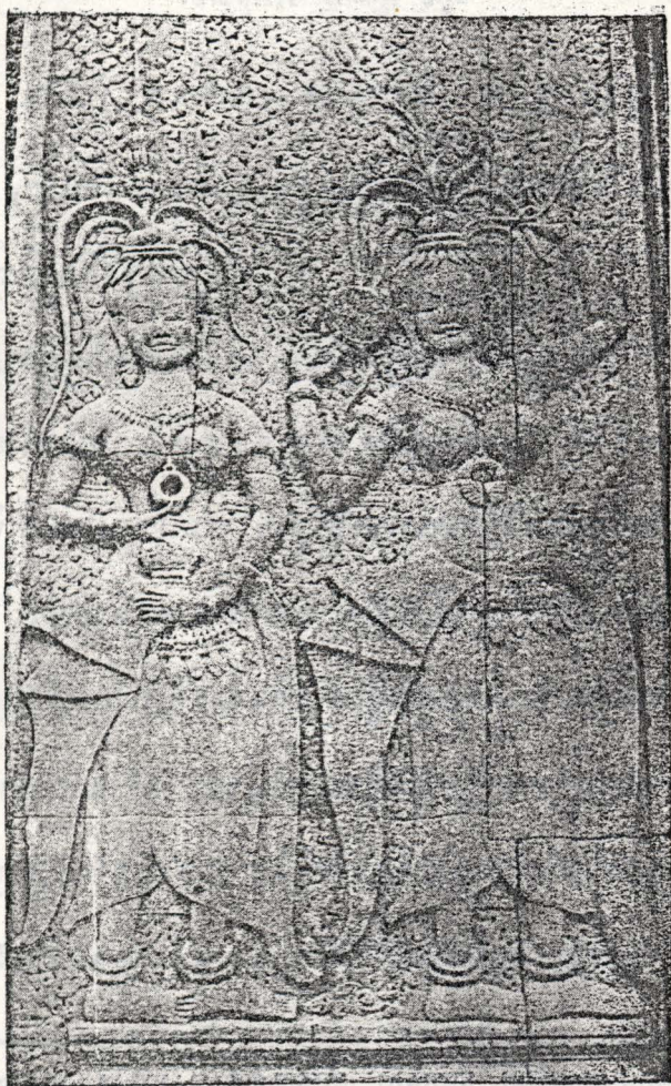
គតរវត្ត — រូបនារីអប្សរនៅទ្វារចូលទិសខាងលិច