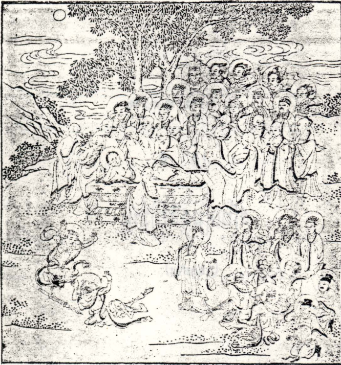
๕๓- สัตว์การบวชญาณ ๖