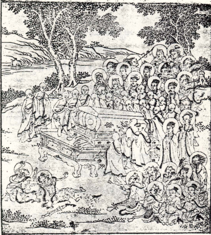
៤៤- អំពីការសៅសោក ។