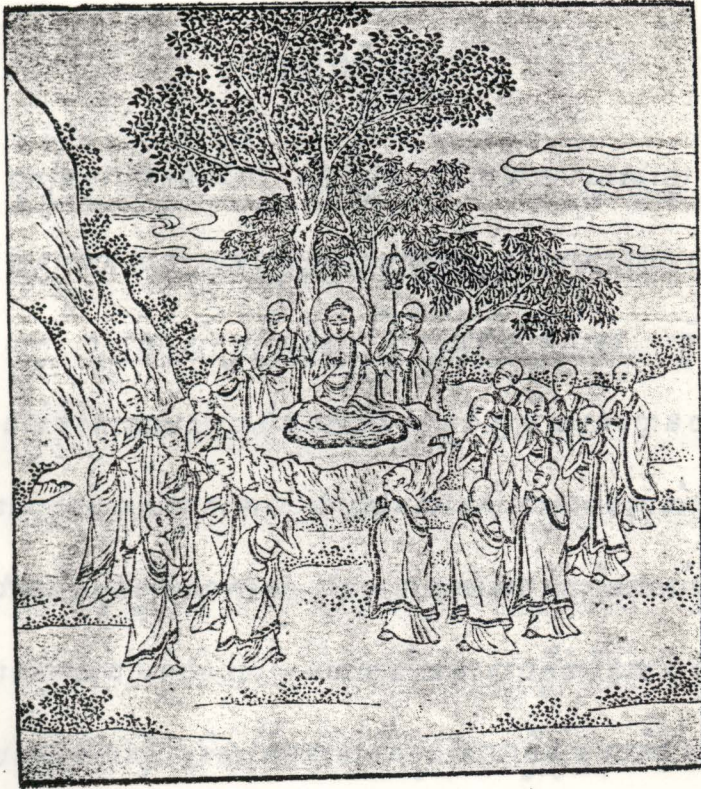
៤២— អំពីព្រះបដិមភិបាររបស់ព្រះពុទ្ធជាម្ចាស់ ។

មានអ្នកប្រាជ្ញគិតស្តាប់ទេ បុរាណកាលតែម្តងស្រីម្នាក់ទៅជាប់ ជំងឺណា គិតគ្រឿងស្លាប់ស្លាប់ដឹងដឹងមួយថ្ងៃ ទៅតាមទាន់សម្រេច មួយថ្ងៃ ៗ ការបែងបែកក្នុងគ្រាទំនេរសំរាប់ដឹងឱ្យឃើញលក្ខណៈរបស់កូន ប្រទេសចក្រស៍ មិនសូវមានប្រយោជន៍ទាន់ប្រសិទ្ធភាពស្រួលភាពសំខេ ។