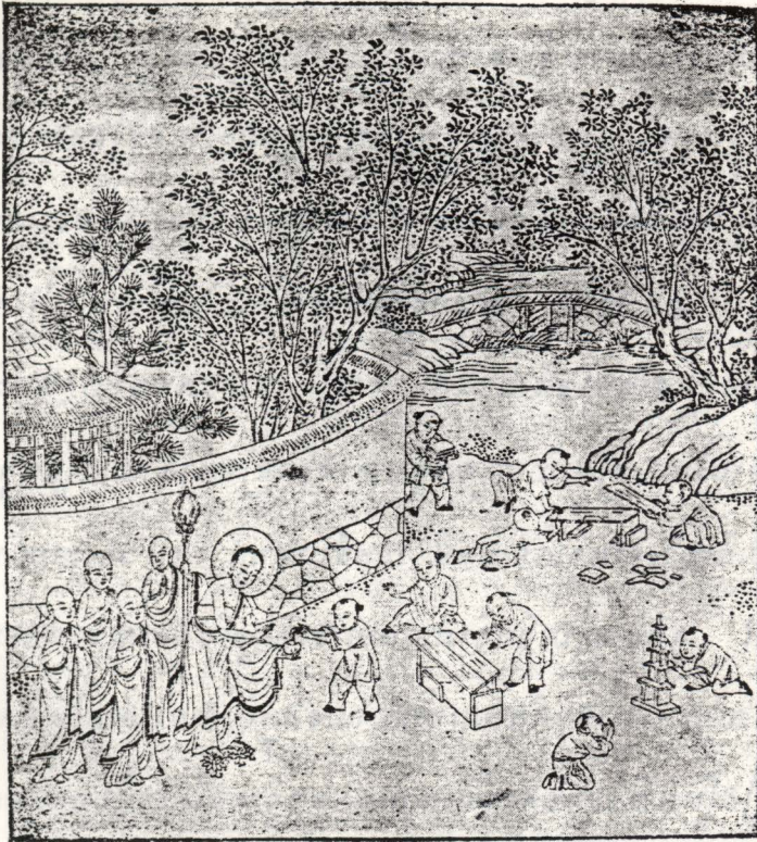
៤- អំពីការបូជាដីខ្យល់ ។