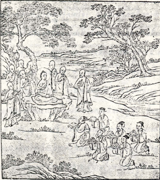
៤១- អំពីការទទួលចម្លែងចុងក្រោយចង្អុល ។