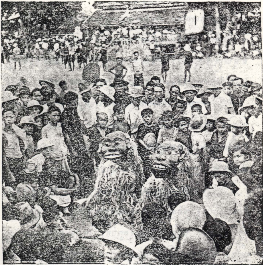
ប្លង់ព្រះបាទ (ប្រទេសលាវ) — ពិធីហែកូនីដ៏ទៅវត្តសៀង និង នៅក្នុងសប្តាហ៍ផ្សេងៗនៃជនជាតិលាវ ។ នៅក្នុងរូបភាពនេះ យើងឃើញប្លង់ព្រះបាទ និង ប្លង់ព្រះមហាក្សត្រ កំពុងប្រើប្រាស់ប្លង់ព្រះបាទ និង ប្លង់ព្រះមហាក្សត្រ ។ ប្លង់ព្រះបាទ និង ប្លង់ព្រះមហាក្សត្រ គឺជាប្លង់ព្រះបាទ និង ប្លង់ព្រះមហាក្សត្រ ។ ប្លង់ព្រះបាទ និង ប្លង់ព្រះមហាក្សត្រ គឺជាប្លង់ព្រះបាទ និង ប្លង់ព្រះមហាក្សត្រ ។