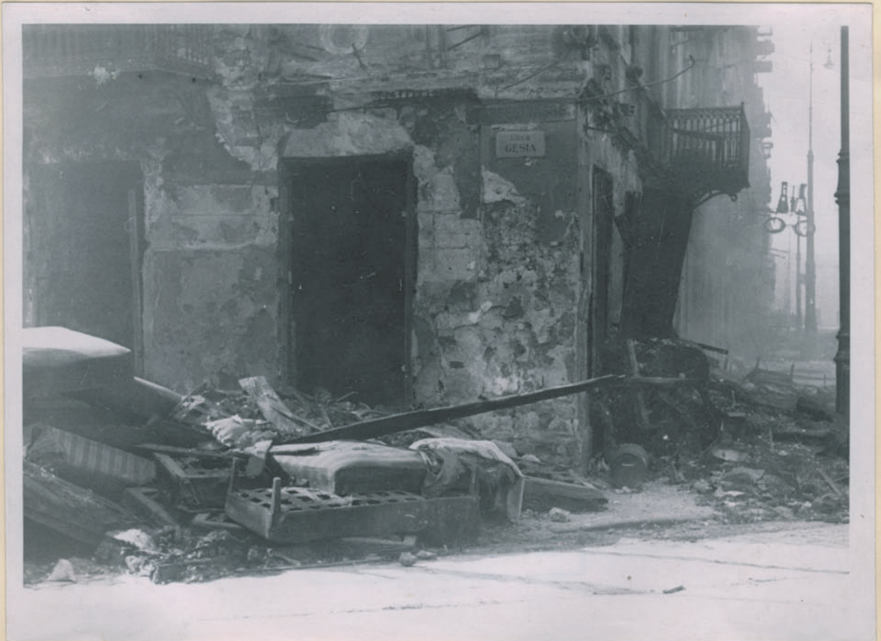
~ Zim Fließt und zum Abprünge doch erwidert cymentowa Placz. ~

Archiwum Główniej Komisji Badania Zbrodni Niem. w Polsce Dok. N. 20/202 X - Inv. 4515