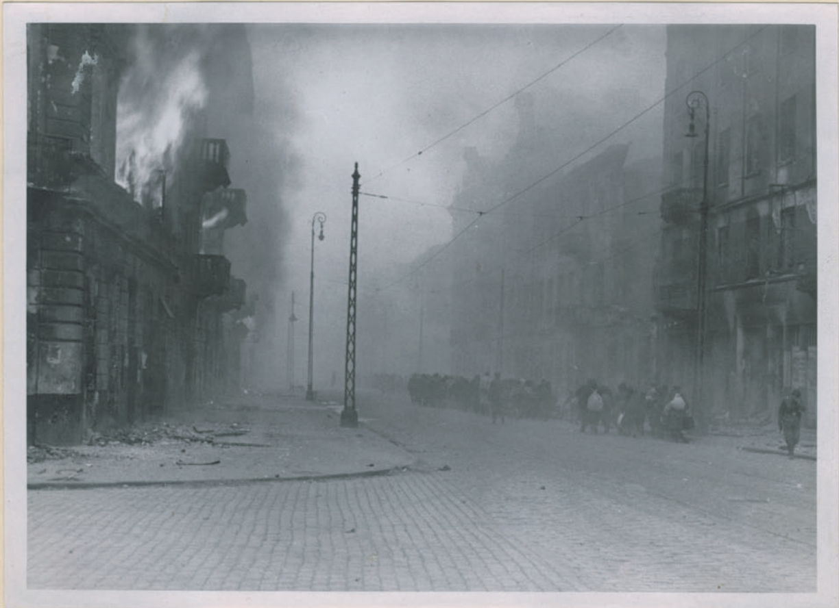
~ Altrambergart von Juden. ~

Archiwum Główniej Komisji Badania Zbrodni Niem. w Polsce Dok. N. 25/2022-708.4521