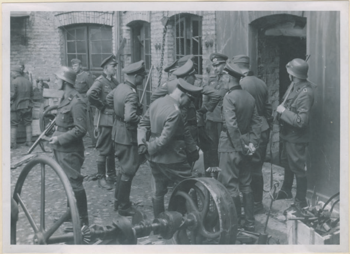
— Die Dänische 116 Britische und Emporen.

Archiwum Główniej Komisji Badania Zbrodni Niem. w Polsce Dok. N. 5/202x - Ino. 4497