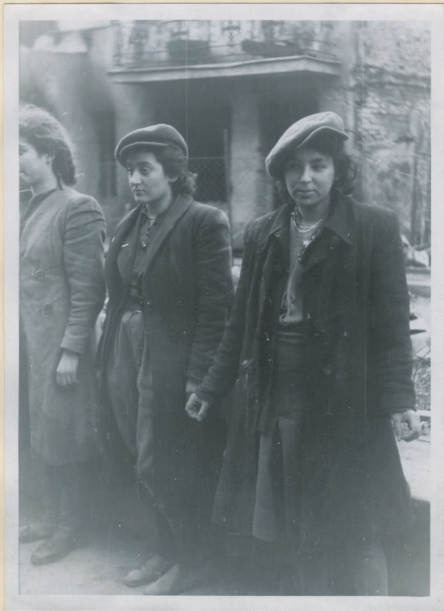
~ Wit Doppenhofmann Dieler der Galizienbewegung! ~