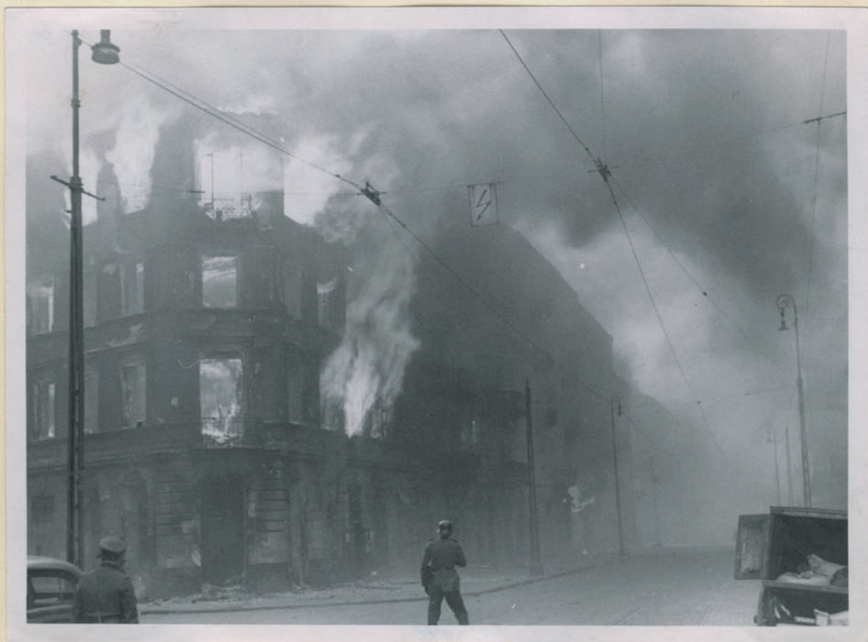
~ Дрезденский вид Гёриплац 26. ~

Archiwum Głównej Komisji Badania Zbrodni Niem. w Polsce Dok. N. 21/2022-Inv 4574