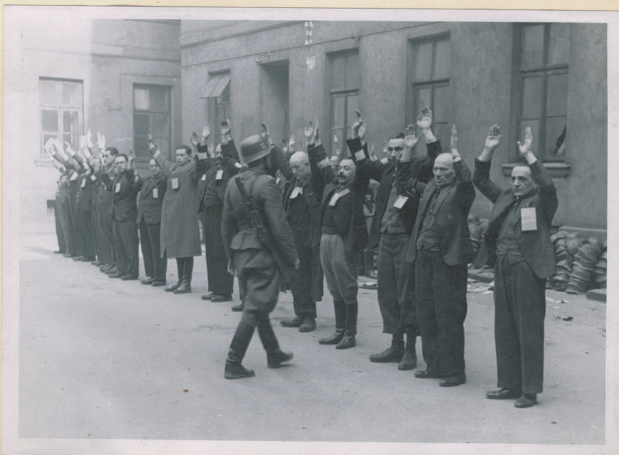
Die jüdischen Arbeitslager der Dittlingwerke - Breslau.

Archiwum Głównej Komisji Badania Zbrodni Niemcy w Polsce Dok. N. 4/202 x - Jm. 4498