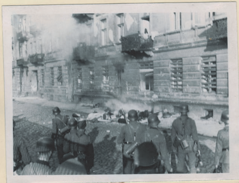
~ Олсгипкннцнм Вонднн. ~

Archiwum Głównej Komisji Badania Zbrodni Niem. w Polsce