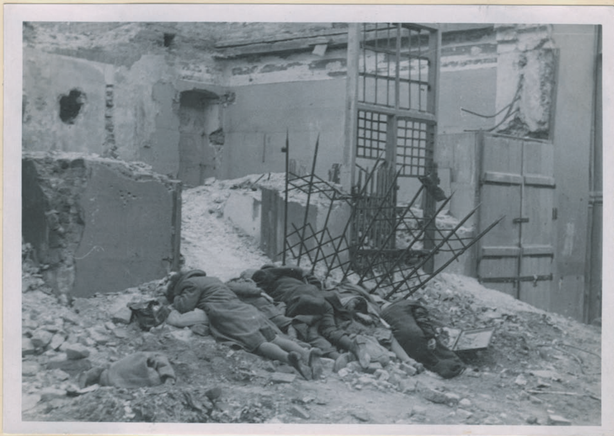
~ Im Camp of concentration Benditz. ~

Archiwum Główniej Komisji Badania Zbrodni Niem. w Polsce Dok. N. 16/2022-Inv. 4519.