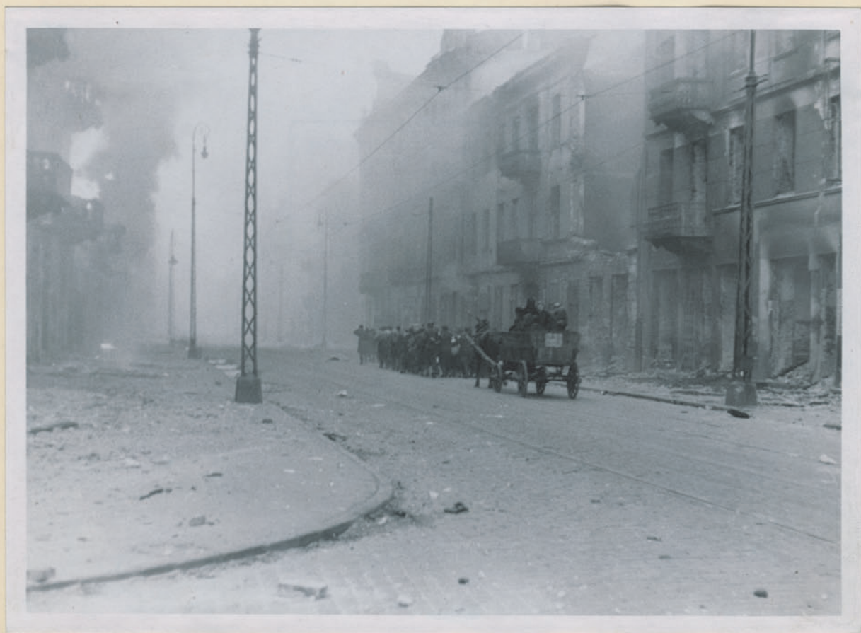
~ To jest ulica w Krakowie. Jechała ona w kierunku Dworzyszynki ulic. ~

Archiwum Głównego Komisji Badania Zbrodni Niem. w Polsce Dok. N. 35/2022 - Ino 43292 4541