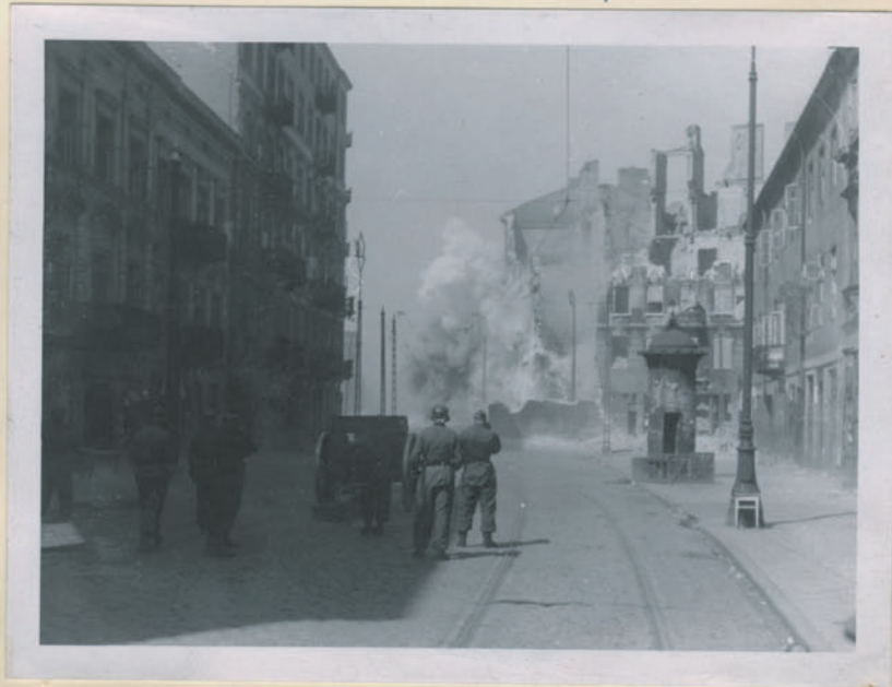
~ Brückengänge zum Stadtkern Brinkowen. ~