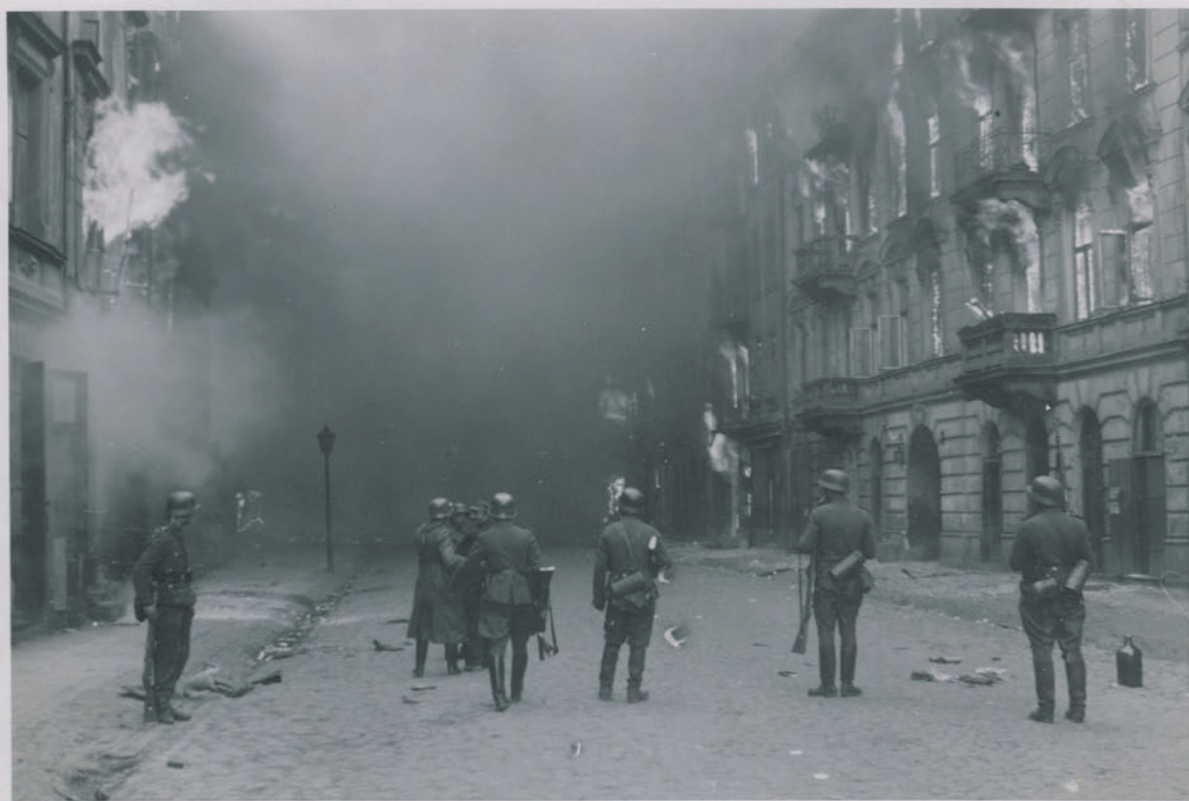
— Обстрел улиц в Варшаве немцами. —