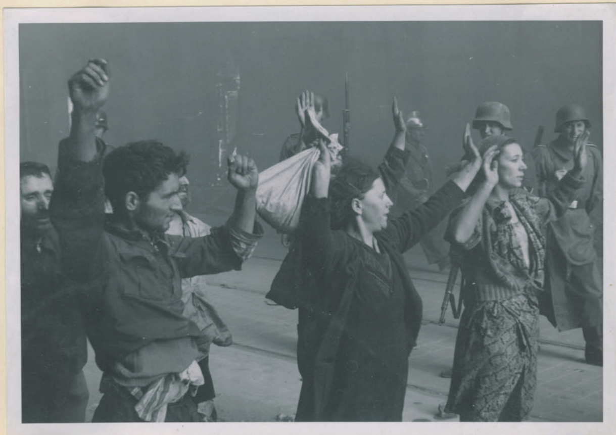
~ Diebstahl von Handtaschen durch die Wehrmacht. ~

Archiwum Głównej Komisji Badania Zbrodni Niem. w Polsce