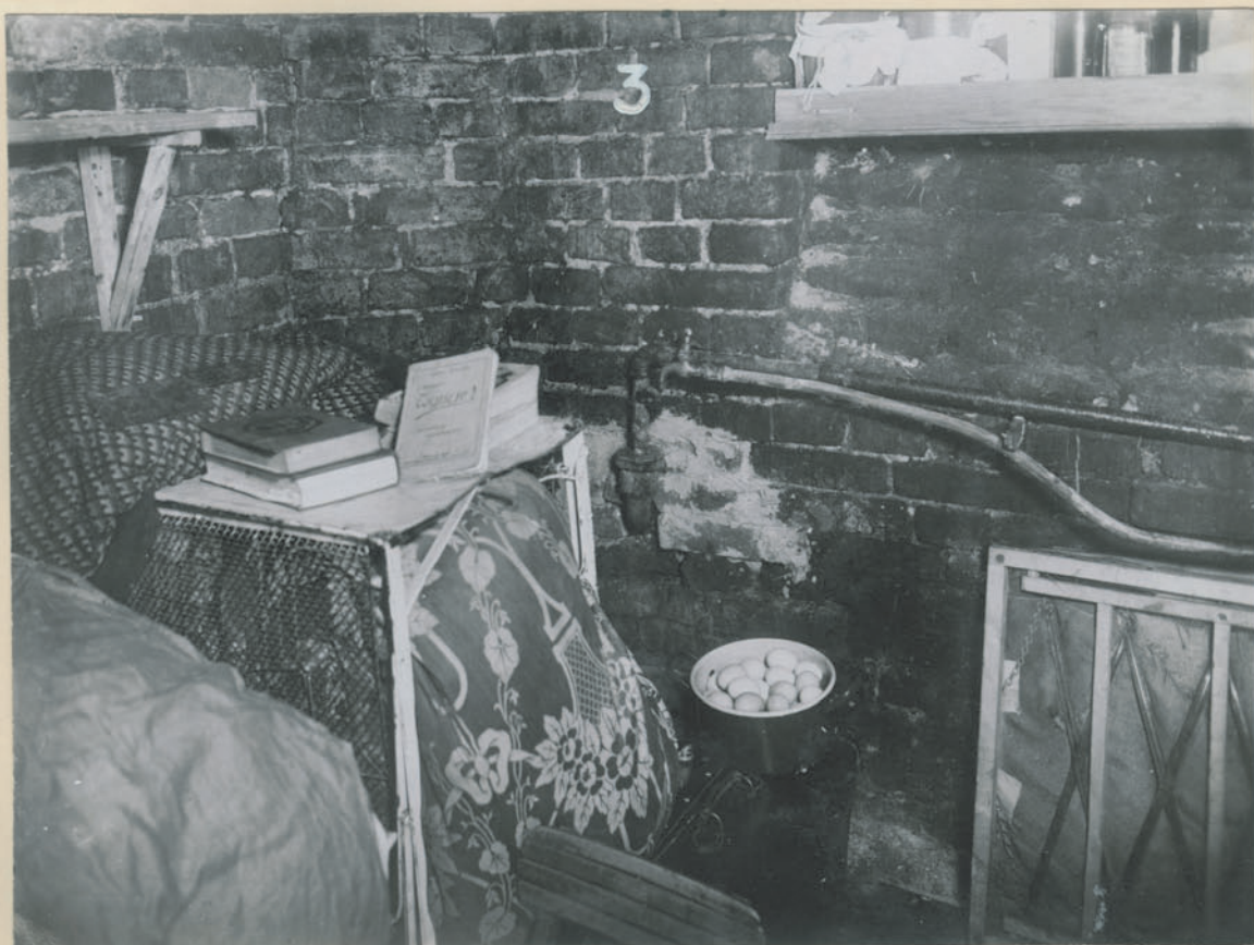
~ Bildnis aus einem Gefangenenraum. ~