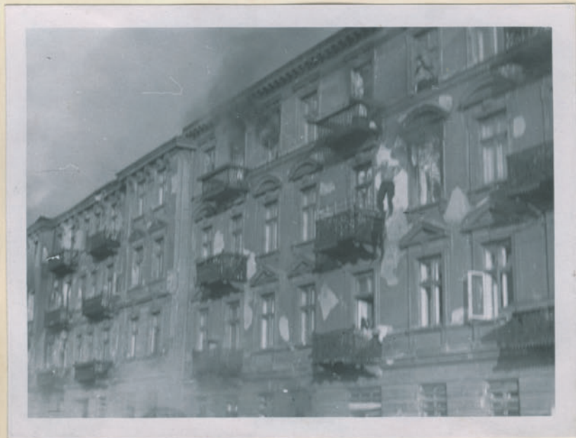
~ Die Banditen sind die Täter der Verbrechen. ~