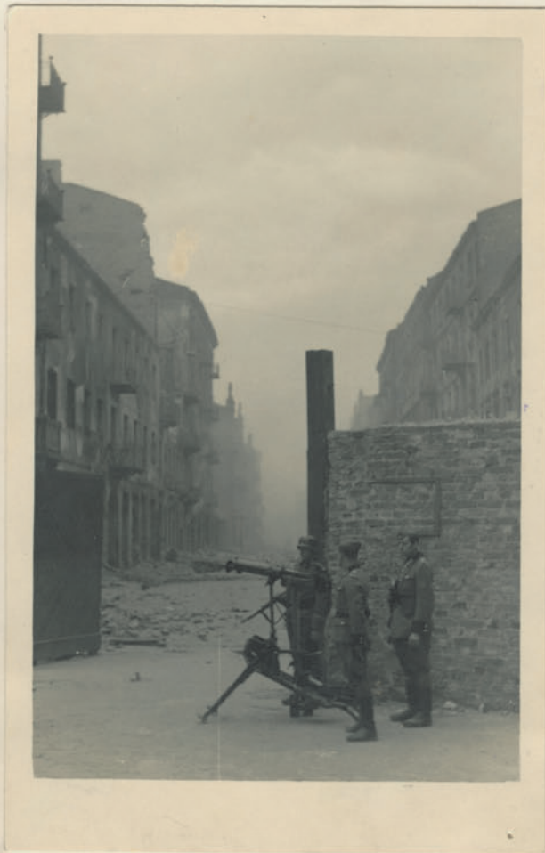
~ Dok. Dok. Dinspüßing ~

Archiwum Głównej Komisji Badania Zbrodni Niem. w Polsce Dok. N. 28/2028-Inv. 4528