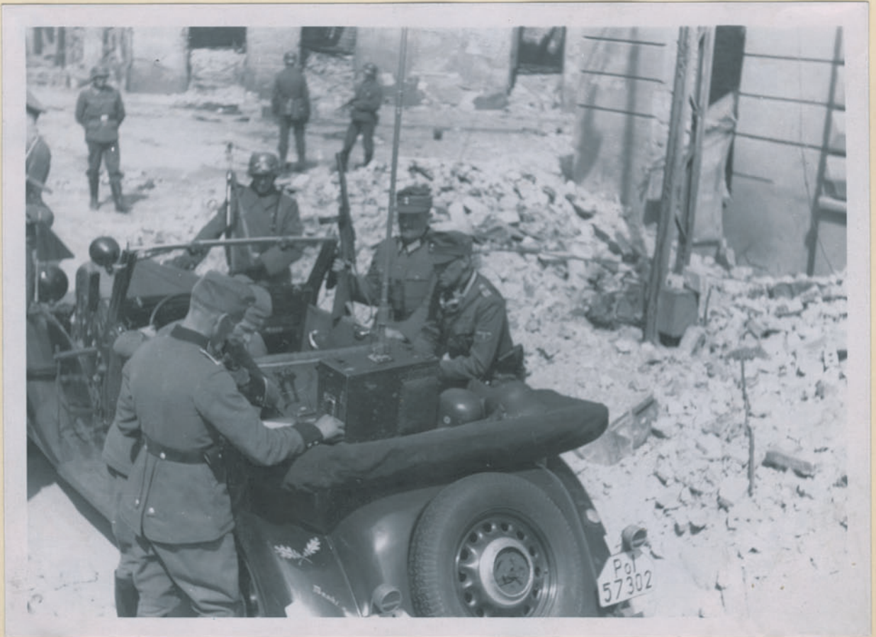
~ Див. Финляндия при Бр. 1945 г. ~

Archiwum Głównej Komisji Badania Zbrodni Niem. w Polsce Dok. N. 58/201 x - Str. 4535