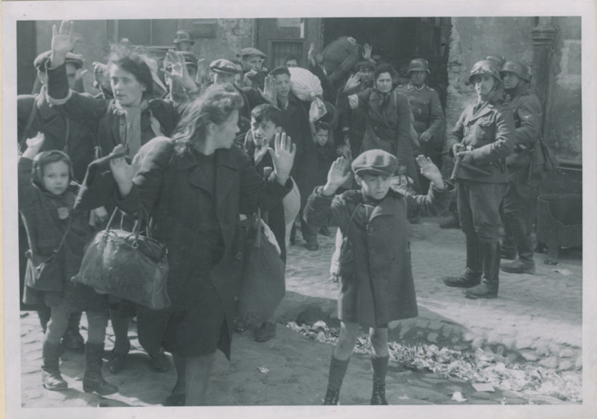
~ Życie Ojcowca i matki Brimbrach Jurockiej. ~

Archiwum Główniej Komisji badania Zbrodni Niem. w Polsce Dok. N. 12/2024-1no 4304