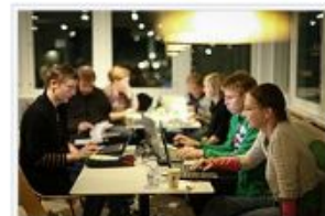
Wikipedian muokkaustapahtuma syksyllä 2014 Tuo kulttuuri Wikipediaan-tapahtumassa.