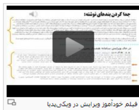
فیلم خودآموز ویرایش در ویکی‌پدیا