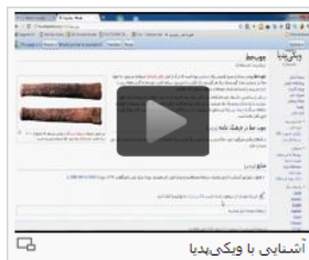
آشنایی با ویکی‌پدیا