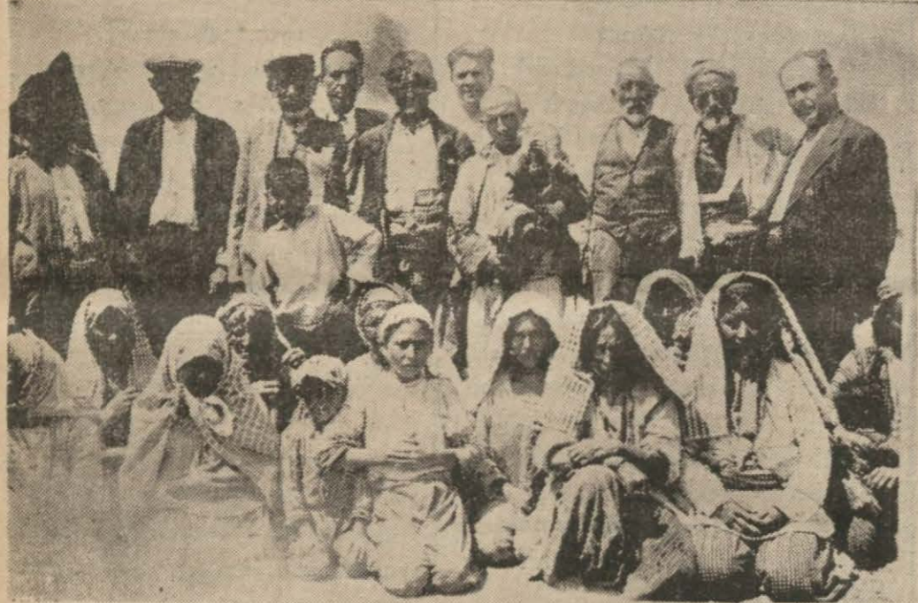
Aydın halkevileri Karaçakal oymağıyla beraber

Yolcu gemisinin tayfaları, çarpışmadan az sonra "Kafiristan", da çıkan yangını söndürmek için yardım etmişlerdir.