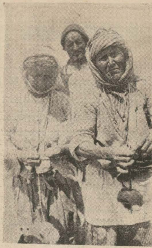
— oymakta seksenlik iki kadınla toru sahibi oğul

Selâmdan kesmesin bizi.. Pek güzel şimdi burası..