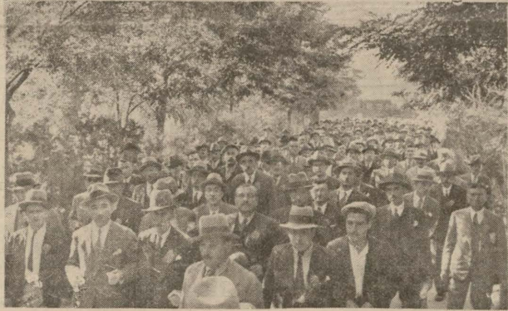
Bursalı konuklar Çankaya köşkünde

Ötey gün Atatürkün kayrasına erdiler ve Çankaya varıp görette bulundular. Dün öğleden sonra Çiftlikte kendilerine bir çay şöleni verildi