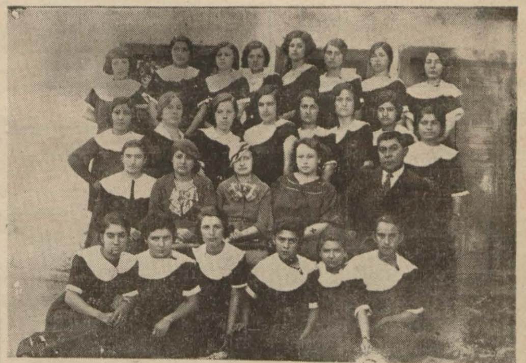
Ankara kadınları Biçki - dikiş yurdu sınaçları bitmiş 23 bayan makastar terzi diploması almıştır. Sınaç için talebenin hazırladığı dikişler ayırtmanlar tarafın-dan çok beğenilmiştir.

Resmimiz ayırtmanları, yurd direktörünü ve diploma alan talebeyi göster-mektedir.