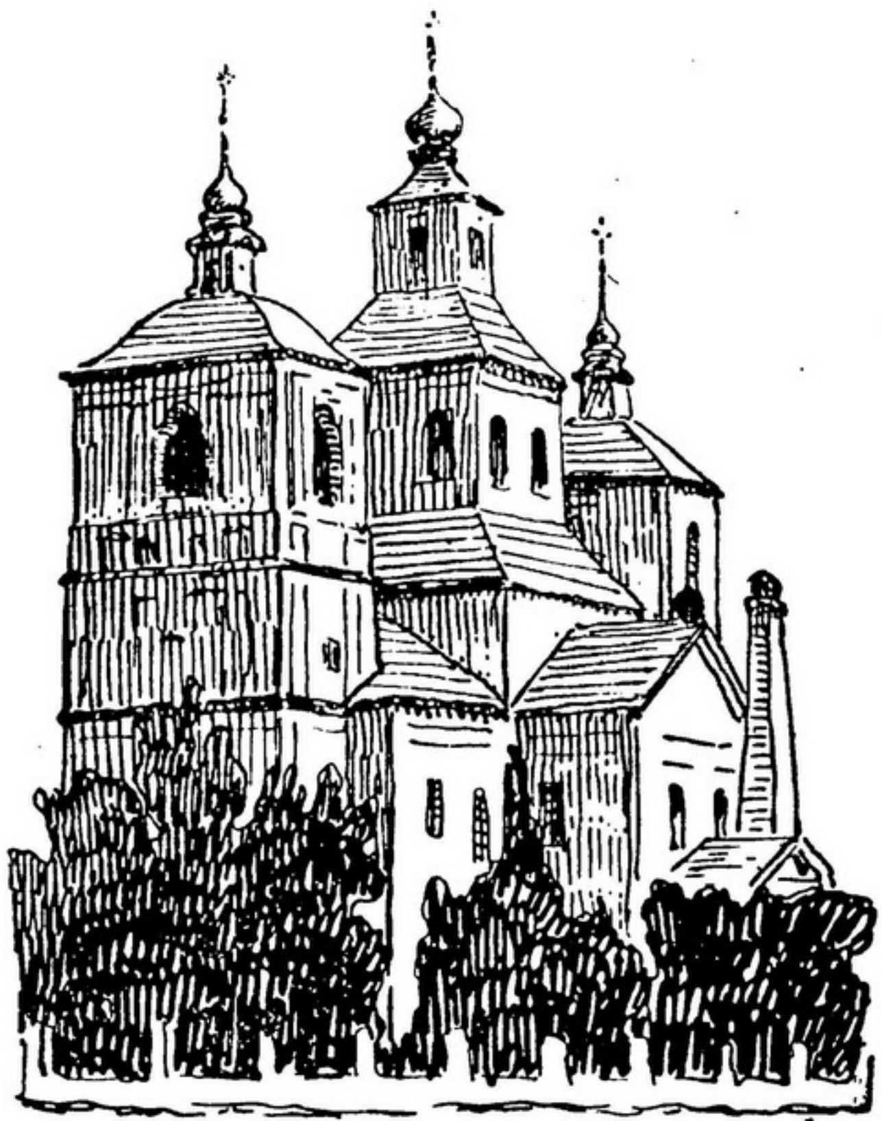
Козацька церква в Остроґожську