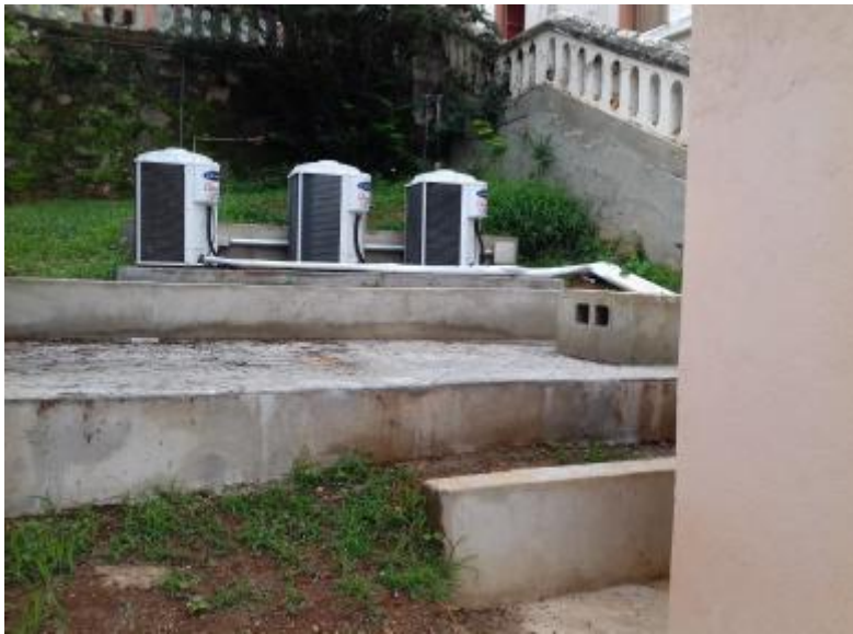
Condensadoras instaladas fora do datacenter