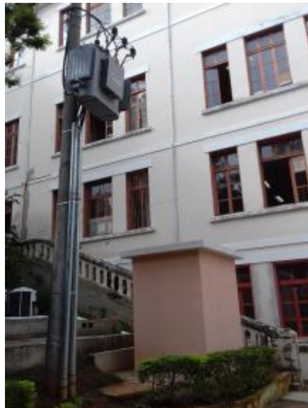
Cubículo e poste com transformador do datacenter