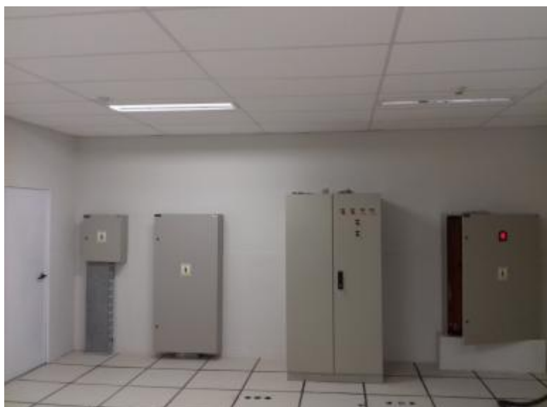
Espaço interno do datacenter, inclusive quadros de alimentação