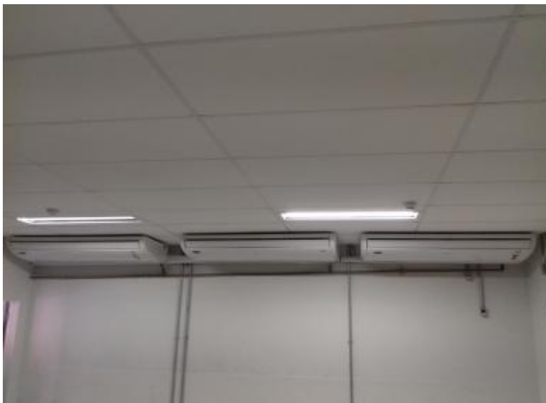
Evaporadoras instaladas dentro do datacenter