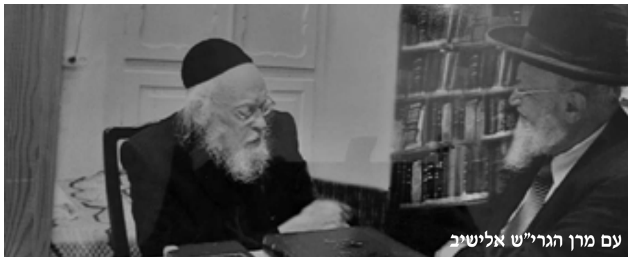
עם מרן הגרי"ש אלישיב

כמו כן קיבל אז סמיכה מעוד כמה מגאוני הדור ממרן ראש הישיבה הגה"ח רבי אליעזר יהודה פינקל ומרן רה"י שה"ת רבי חיים שמואלביץ , וכן מהגאונים