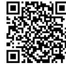
QR Code 7

QR Code 7 之影片中1分09秒所引述年份的問題，我們確實發現了自己的錯誤與不準確之處，如您來信所提，記者既然引用得到授權片段，理應清楚作品基本資訊，年份引用不精確，再次向您致歉，我們會深刻檢討並改進。