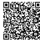
QR Code 3