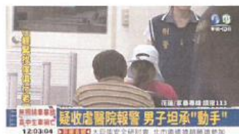
阿姨, 男友動手 女童受虐昏迷