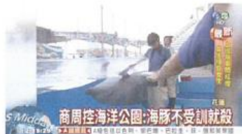
商週爆料: 海洋公園虐訓海豚