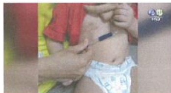
【午間搶先報】摔下床頭撞插座? 2歲女童命危