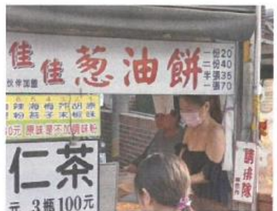
蔥油餅正妹 網友:濃濃的奶香