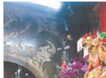
2019/04/08 10:00 白沙屯媽祖APP GPS定位 握媽祖位置