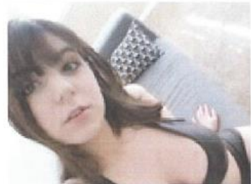
2019/04/08 10:15 暗黑版正妹莎莎 女coser 辣「超不科學」