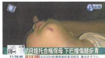
7月娃托嬰 全身傷 家長控受虐