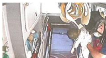
菸頭燙手, 燒腳指 受虐3歲女童不治