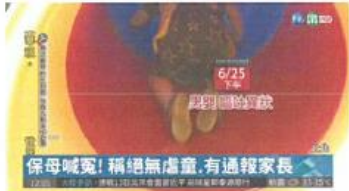
嬰顱內出血未脫險 疑遭外力虐待