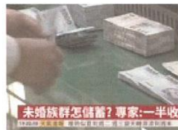
2019/04/07 19:55 月賺36K不夠用! 北光族