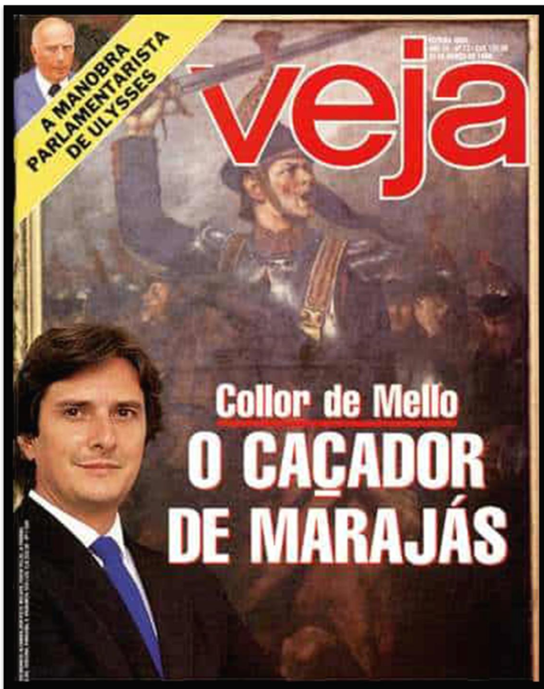
Figura 6 – Capa da revista Veja retratando Fernando Collor de Mello no início da campanha para a eleição de 1989.

A Veja tinha o objetivo de apresentá-lo para o Brasil e publicou em sua capa uma fotografia de Fernando Collor de Mello em frente a um quadro