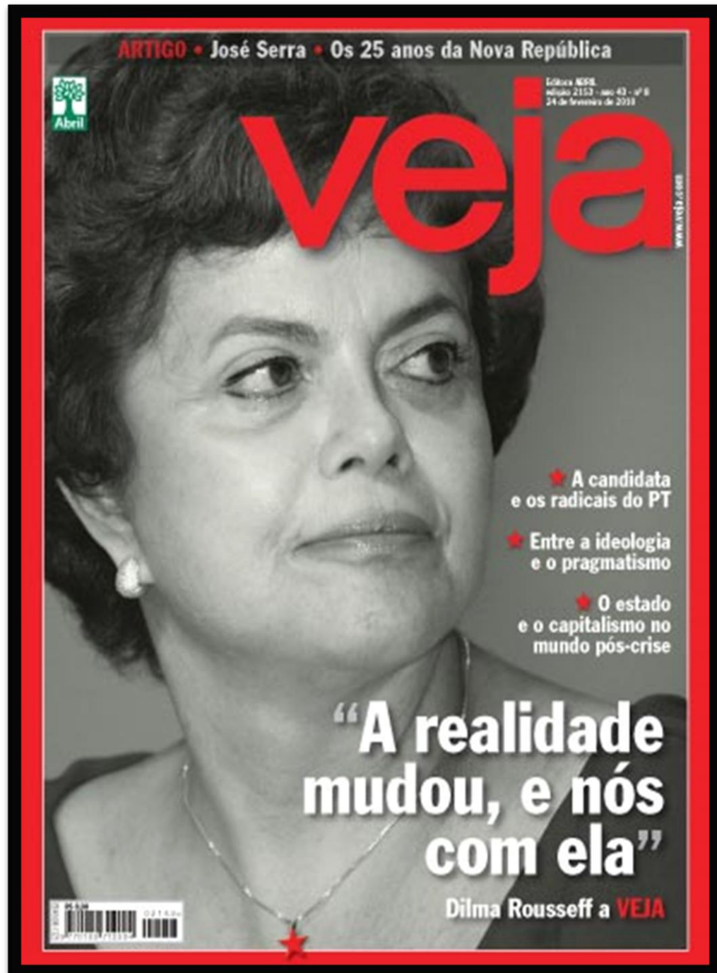
Figura 14 – Capa da revista Veja retratando Dilma Rousseff.

A revista Veja nesta capa vem com a fotografia em preto e branco de Dilma Rousseff em forma de retrato com moldura vermelha e um olhar