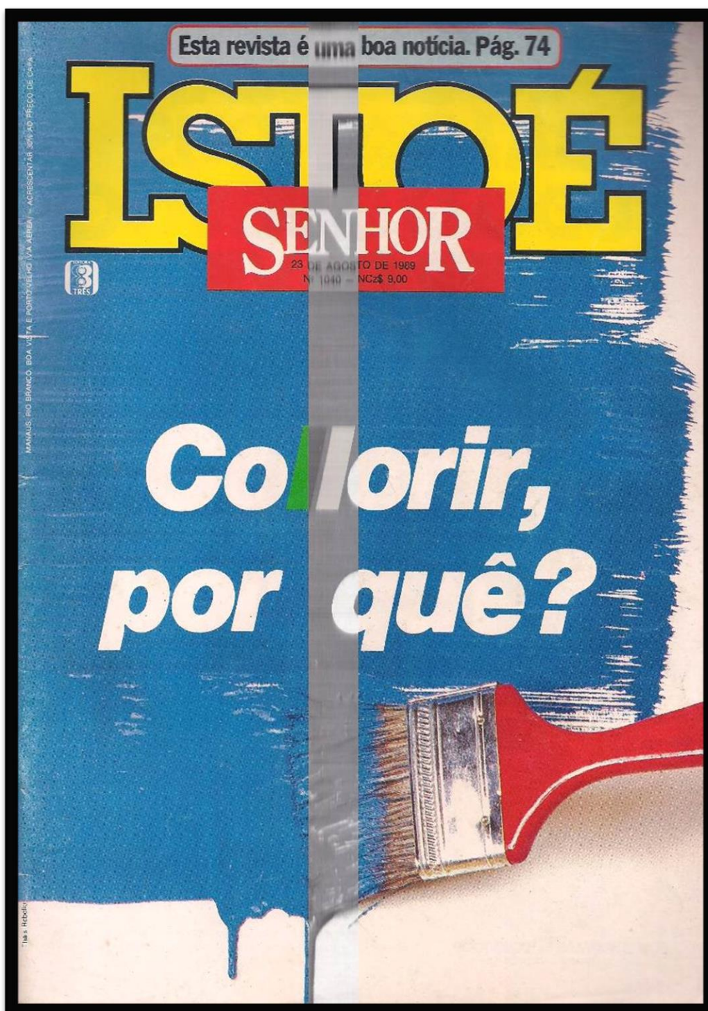
Figura 10 – Capa da revista ISTOÉ apresentando o candidato Fernando Collor de Mello.

A revista ISTOÉ nesta capa em dado momento da campanha questiona o motivo pelo qual deveríamos votar em Fernando Collor de Mello sem deixar transparecer interesses próprios nesse questionamento. Para isso utilizou-se de uma estratégia diferente da revista Veja, ao invés de utilizar fotografia do