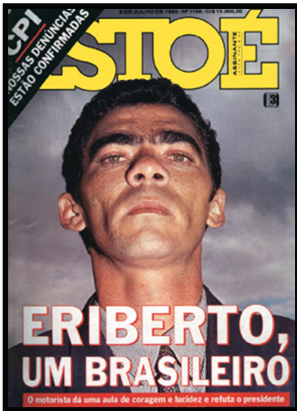
Figura 12 – Capa da revista ISTOÉ retratando o motorista de Fernando Collor de Mello.

A capa da ISTOÉ acima mantém a postura informativa e traz no alto a esquerda uma tarja preta com texto em branco “CPI nossas denúncias estão confirmadas”. A publicação traz uma fotografia em close do motorista do então presidente Fernando Collor de Mello, porém, essa foto apresenta uma