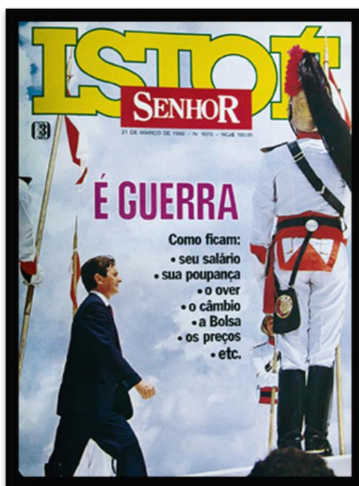
Figura 5 – Capa da Revista ISTOÉ