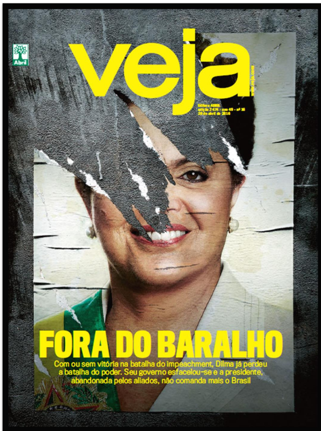
Figura 16 – Capa da revista Veja retratando Dilma Rousseff.

Nesta edição a revista traz uma representação do que seria o quadro com a fotografia do Presidente da República, porém, a fotografia de Dilma Rousseff no quadro está rasgada como se alguém estivesse tentando retirá-la do quadro. O nome da revista aparece em amarelo, assim como a chamada de capa em