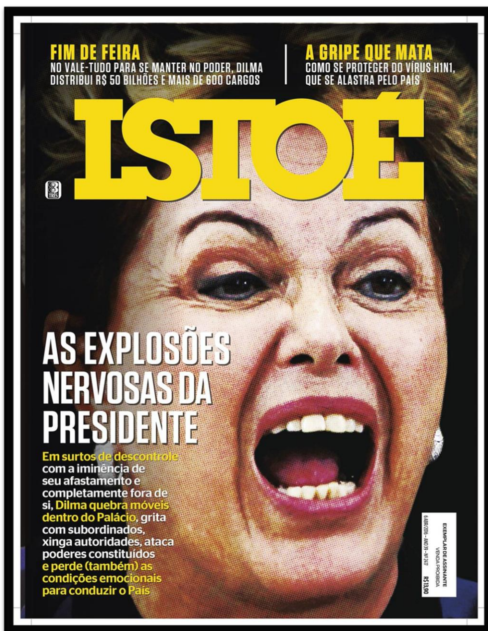
Figura 19 – Capa da revista ISTOË retratando Dilma Rousseff.

Na capa acima a revista nos apresenta um retrato em big close de Dilma Rousseff em um momento inusitado. No alto em caracteres pequenos duas chamadas, a direita, “A GRIPE QUE MATA (em amarelo) – Como se proteger do vírus H1N1 que se alastra pelo país” (em branco) e a esquerda, “FIM DE FEIRA (em amarelo) – No vale-tudo pra se manter no poder, Dilma distribui R$ 50 bilhões e mais de 600 cargos” (em branco). A seguir o nome da revista em amarelo. Do lado esquerdo, na altura da boca na fotografia de Dilma