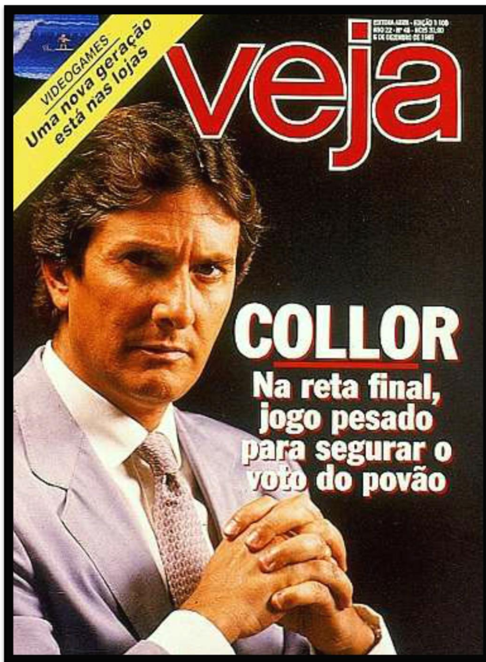
Figura 7 – Capa da revista Veja retratando Fernando Collor de Mello no final do campanha.

Nesta capa a revista Veja trás no topo uma tarja amarela com os dizeres “Videogames uma nova geração está nas lojas”, o nome da revista agora vem em vermelho com contornos brancos e o texto “Collor (sublinhado em vermelho) Na reta final, jogo pesado para segurar o voto do povão” em branco. Collor aparece na foto com um terno e gravata claras em perfeita