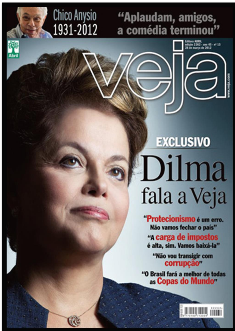
Figura 15 – Capa da revista Veja retratando Dilma Rousseff.

Nesta edição, no alto temos uma tarja preta em alusão a morte de Chico Anysio, uma pequena fotografia do humorista sorrindo seguido dos textos: “Chico Anysio 1931 – 2012” e “Aplaudam, amigos, a comédia terminou”.