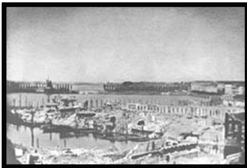
Figura 1 – Ruínas de Hamburgo, 1842 Autor Carl Friedrich Stelzener

Fonte: Livro Uma História Crítica do Fotojornalismo Ocidental