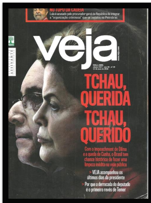
Figura 4 – Capa da Revista Veja

De acordo com o IVC – Instituto Verificador de Comunicação, a Revista Veja apresentou média de 243.400 exemplares em 2019.