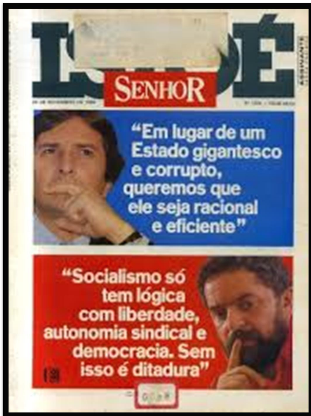
Figura 11 – Capa da revista ISTOÉ retratando a disputa final entre Fernando Collor de Mello e Luís Ignacio Lula da Silva.

Para esta capa a revista ISTOÉ trás seu nome estampado em preto, seguido do destaque para a segmentação de público desta edição em branco com fundo vermelho. A seguir, surge uma fotografia recortada de Fernando Collor de Mello sobreposta em um fundo azul e acompanhada da frase “Em