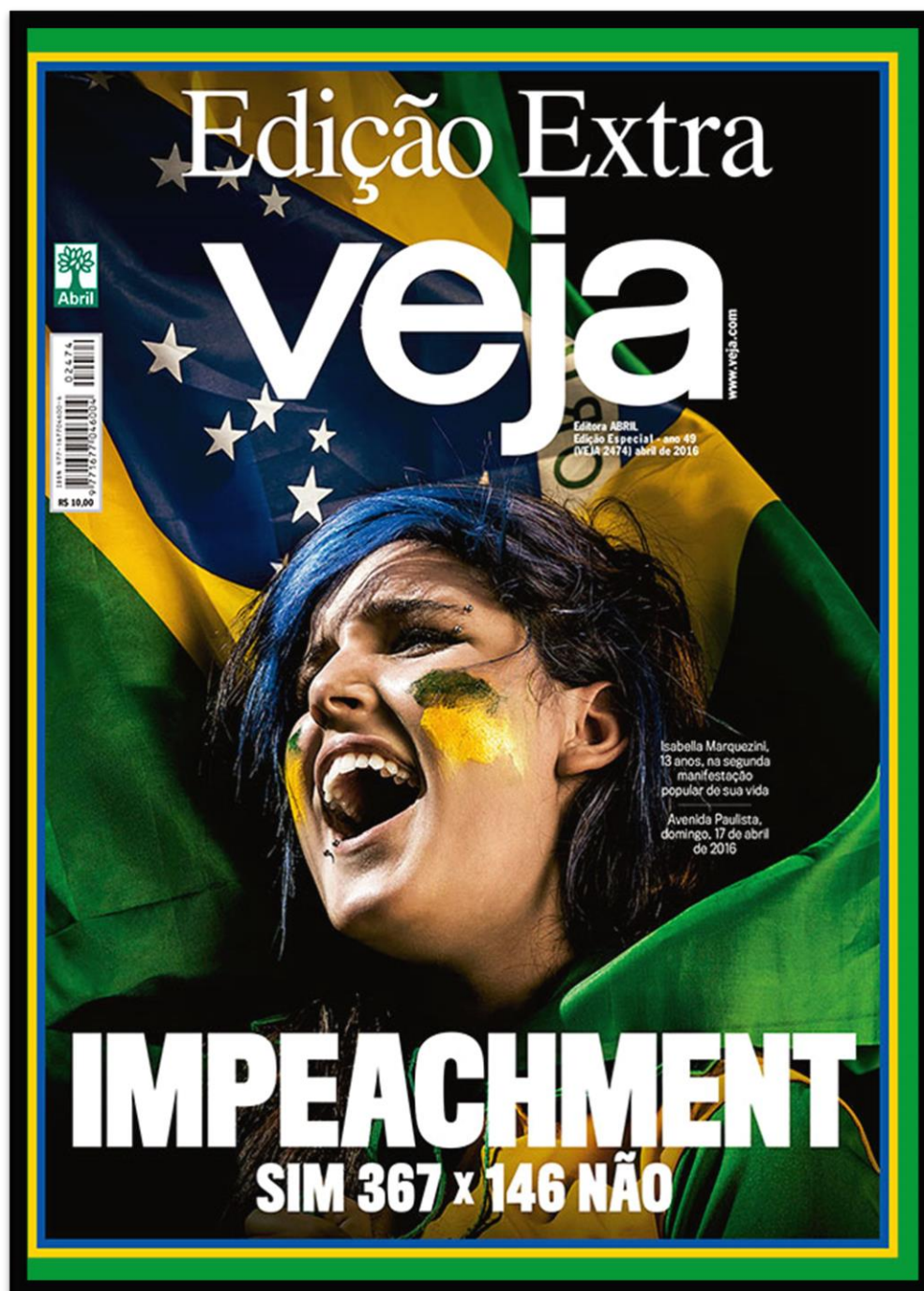
Figura 17 – Capa da revista Veja em edição extra retratando uma jovem enrolada na bandeira do Brasil.

A edição extra acima trata do dia da votação na câmara dos deputados, o nome da revista aparece no alto e em branco, em baixo, também em branco, a chamada com os caracteres em caixa alta “IMPEACHMENT” e “SIM 367 X 146 NÃO”. A capa vem com a fotografia da jovem Isabella Markezini com o rosto pintado de verde e amarelo e enrolada em uma bandeira do Brasil, para explicar a foto a legenda: “Isabella Markezini 13 anos na segunda