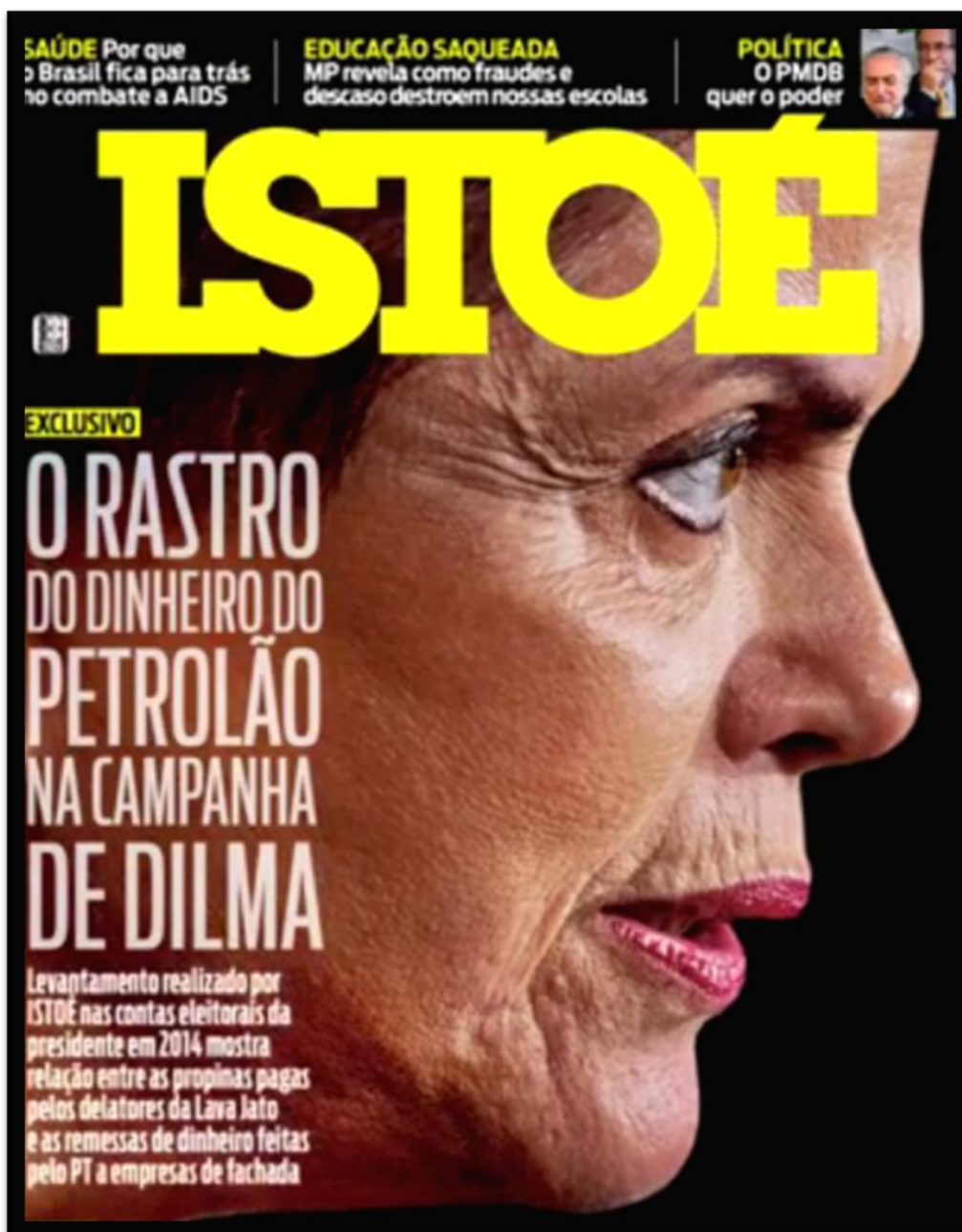
Figura 20 – Capa da revista ISTOÉ retratando Dilma Rousseff.

Na capa acima a revista segue seu padrão de apresentar chamadas secundárias acima do nome da revista que novamente vem em amarelo. A chamada da direita é: “SAÚDE – Porque o Brasil fica para trás no combate a AIDS”, no centro: EDUCAÇÃO SAQUEADA – MP revela como fraudes e descaso destroem nossas escolas” e a esquerda: POLÍTICA – O PMDB quer o poder” com uma pequena fotografia onde se pode ver a frente o então vice-