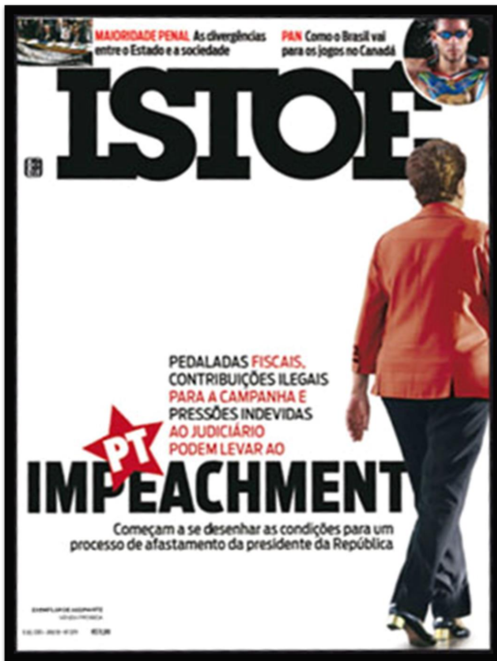
Figura 21 – Capa da revista ISTOÉ retratando o processo de impeachment de Dilma Rousseff.

Nesta edição a opção foi por uma mescla das cores branco, vermelho e preto. O nome da revista vem em preto. Acima do nome da revista, duas chamadas, a direita: “MAIORIDADE PENAL (em vermelho) – As divergências entre o estado e a sociedade (em preto)”; a esquerda: “PAN (em vermelho) – Como o Brasil vai para os jogos do Canada (em preto)”;