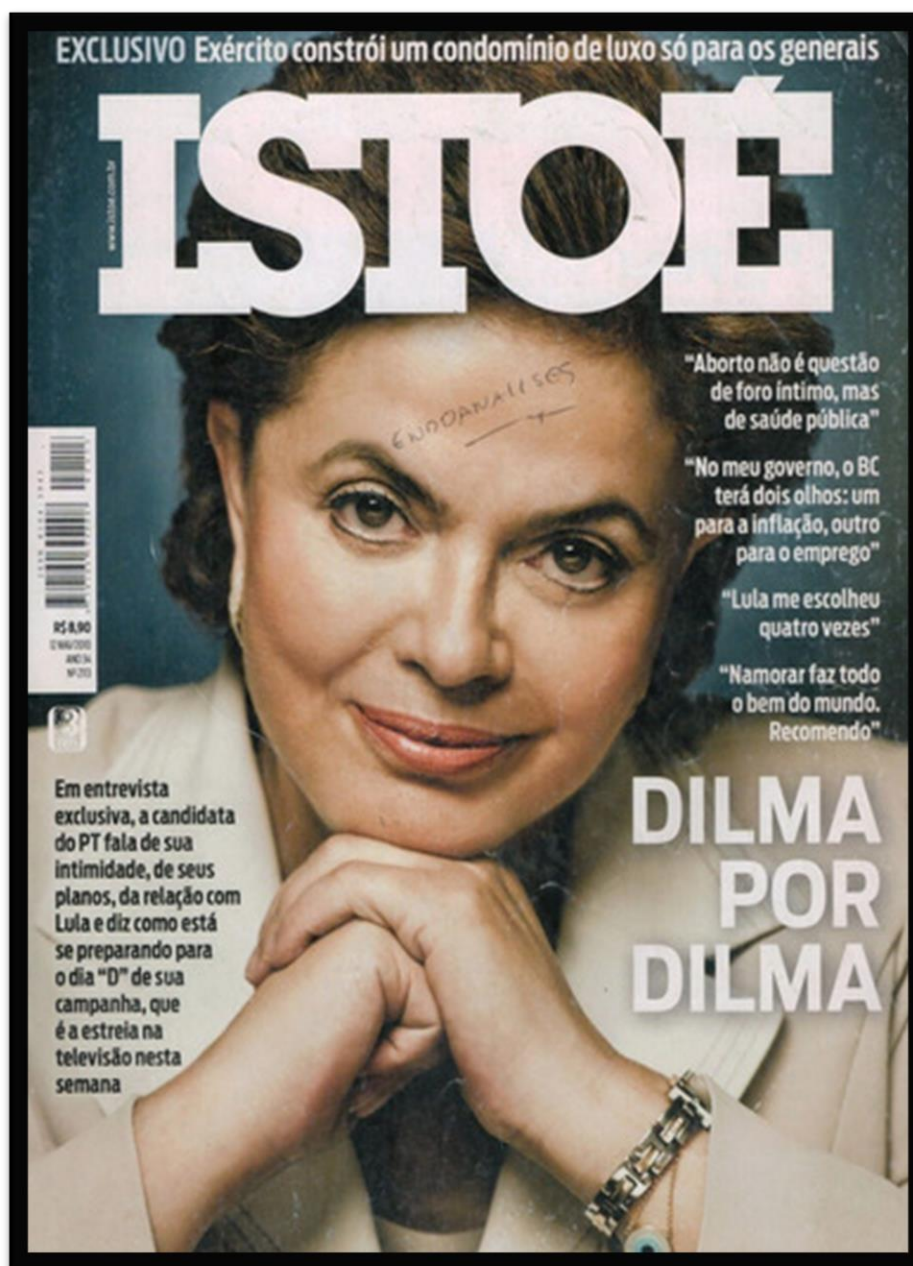
Figura 18 – Capa da revista ISTOÉ retratando Dilma Rousseff.

A revista ISTOÉ apresenta nesta capa uma fotografia de Dilma Rousseff com semblante aparentando calma, com um leve sorriso, roupas elegantes e claras, bem maquiada, com o queixo apoiado sobre as mãos sobrepostas e um olhar direto para a câmera do fotógrafo em um registro posado. O nome da revista aparece em caracteres brancos e acima do nome da revista, a primeira chamada com o texto também em branco da conta de uma matéria exclusiva: “EXCLUSIVO - Exército constrói um condomínio de luxo