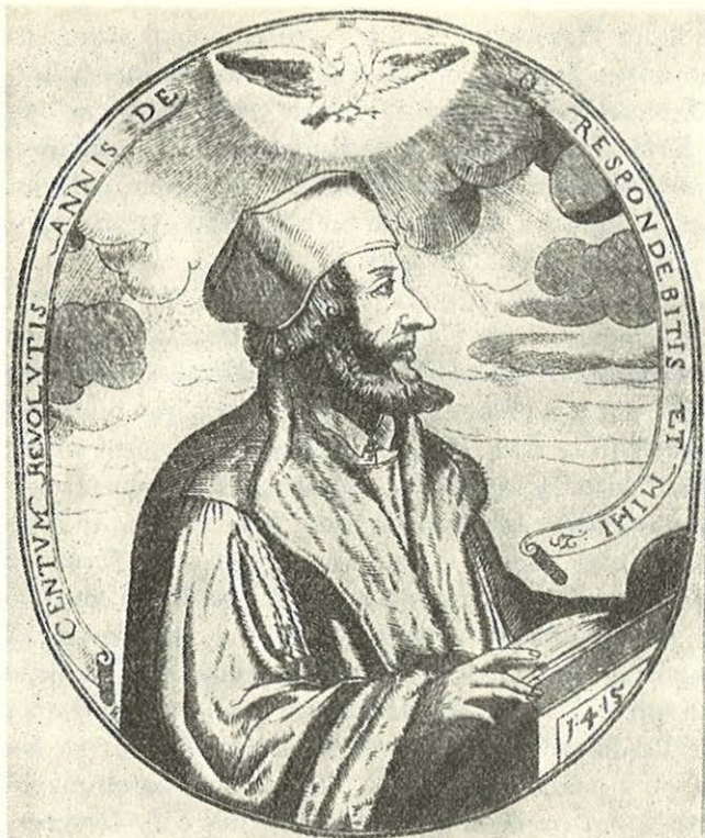
M. Jan Hus, bratrský kancionál z roku 1576.