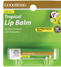
약용 립밤, 0.15oz. 수량: 1