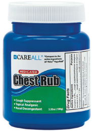
바르는 감기 연고, 3.5oz. 수량: 1