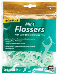
치간치솔 수량: 90