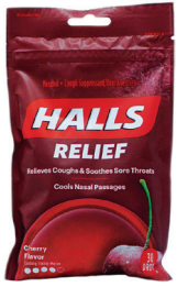
기침 캔디, Halls® 수량: 25