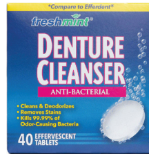
의치용 세척 정 수량: 40