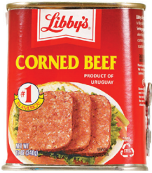
콘 비프, 12oz. 수량: 1