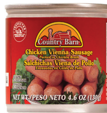
비엔나 소시지, 4.6oz. 수량: 1