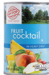
프루트 칵테일, 14.5oz. 수량: 1