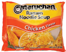
라면, 3oz. 수량: 1