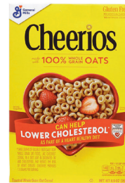
Cheerios™, 8.9oz. 수량: 1