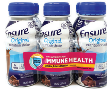
Ensure® 초콜릿 셰이크, 8oz. 수량: 6