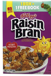
Raisin Bran®, 16oz. 수량: 1