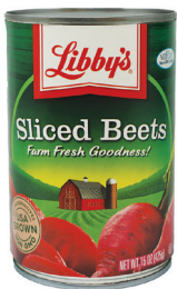
비트(슬라이스), 14.5oz. 수량: 1