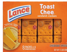
샌드위치 크래커(체다) 개수: 8팩