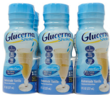
Glucerna® 바닐라 셰이크, 8oz. 수량: 6