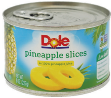
파인애플(슬라이스), 8oz. 수량: 1