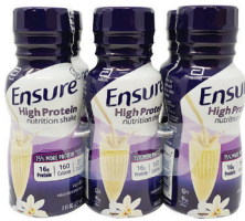
Ensure® 바닐라 셰이크, 8oz. 수량: 6