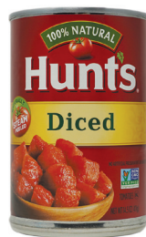
토마토(다이스 컷), 14.5oz. 수량: 1