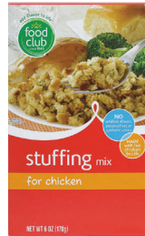
스터핑 믹스, 6oz. 수량: 1