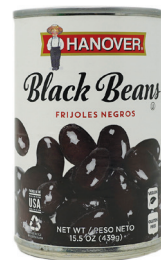
블랙 빈, 15oz. 수량: 1