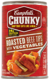
스테이크와 야채 수프, 18.8oz. 수량: 1