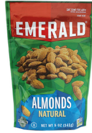
아몬드, 5oz. 수량: 1