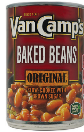
베이컨드 빈즈, 16oz. 수량: 1