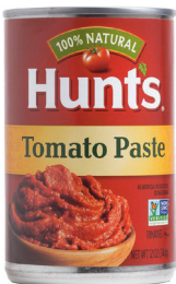
토마토 페이스트, 12oz. 수량: 1