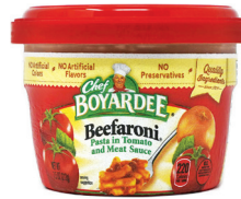
비파로니, 7oz. 수량: 1