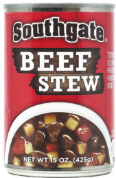
비프 스투, 15oz. 수량: 1