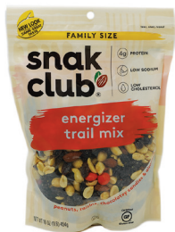
트레일 믹스, 16oz. 수량: 1