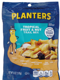
水果和坚果混合, 6 盎司 数量: 1