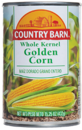
玉米, 14 盎司 数量: 1