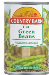
绿豆, 14 盎司 数量: 1