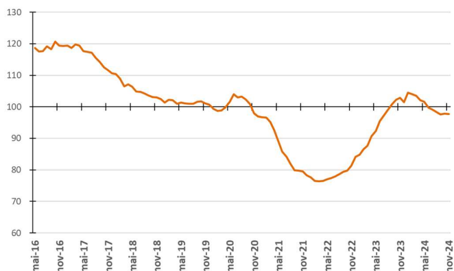
Figura 3 - Evolução da média móvel do comprometimento da receita do Tesouro com a despesa total - %

Na Figura 3, são apresentadas as médias móveis dos percentuais de comprometimento da receita com a despesa total em 12 meses. Assim, cada ponto da figura representa o percentual calculado a partir da divisão do somatório das despesas de pessoal, precatórios, custeio e capital nos últimos 12 meses pelo somatório das parcelas de recursos financeiros repassados à USP nos últimos 12 meses.