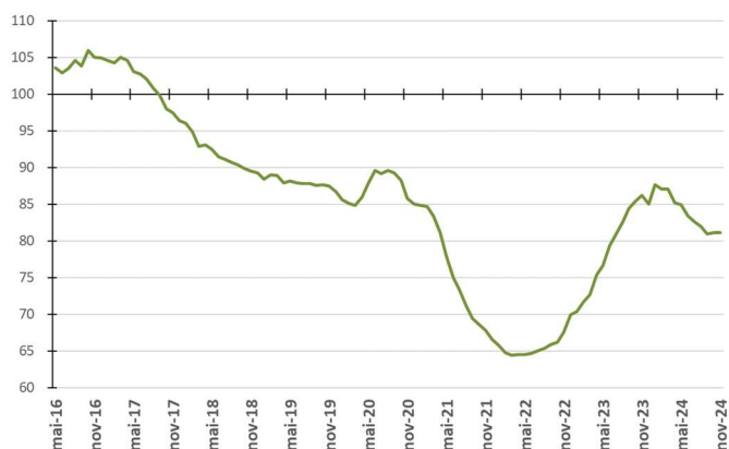
Figura 2 - Evolução da média móvel do comprometimento da receita do Tesouro com pessoal - %

Na Figura 2, são apresentadas as medidas de tendência dos percentuais de comprometimento anual (média móvel). Assim, cada ponto da figura representa o percentual calculado a partir da divisão do somatório das folhas de pagamento dos últimos 12 meses pelo somatório das parcelas de recursos financeiros repassados à USP nos últimos 12 meses.