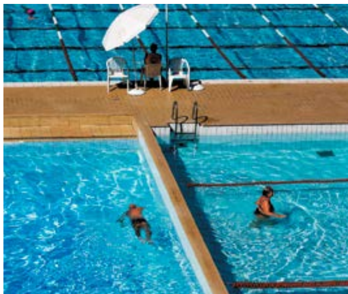
MELHORIAS - Novos guarda-sóis foram instalados no parque aquático do clube

Todos os produtos adquiridos passaram por cotação e atenderam aos critérios do Fluminense, que priorizou a qualidade do material, segurança e durabilidade. O clube contou com o apoio dos sócios na realização das gravações e pretende continuar com as locações em 2017, sempre realizando o processo com transparência.