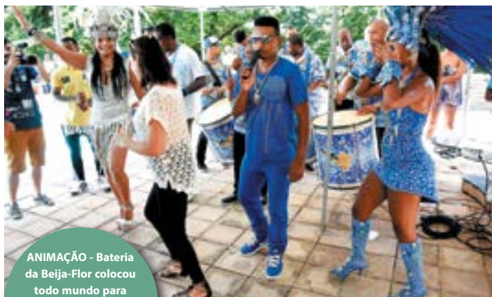
ANIMAÇÃO - Bateria da Beija-Flor colocou todo mundo para sambar (acima). Abaixo, ex-presidente Peter Siemsen é cumprimentado