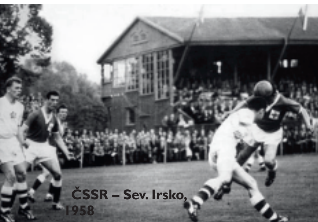
ČSSR – Sev. Irsko, 1958

Ať už se komunita nakonec Wikizpráv nakonec rozhodne revoluční plán realizovat, nebo ne, Wikizprávy by už do konce roku mohly překonat malé jubileum 1500 napsaných zpráv. Už nyní jsou v pořadí všech jazykových verzí na 14. místě, o čtyři příčky výš než je ve stejném srovnání česká Wikipedie. Klidně by se ale mohly navíc stát pro jiné jazyky nositelem nové inspirace.