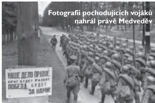
Fotografii pochodujících vojáků nahrál právě Medveděv

Nahrávání fotografií se osobně zúčastnil prezident Dmitrij Medveděv,