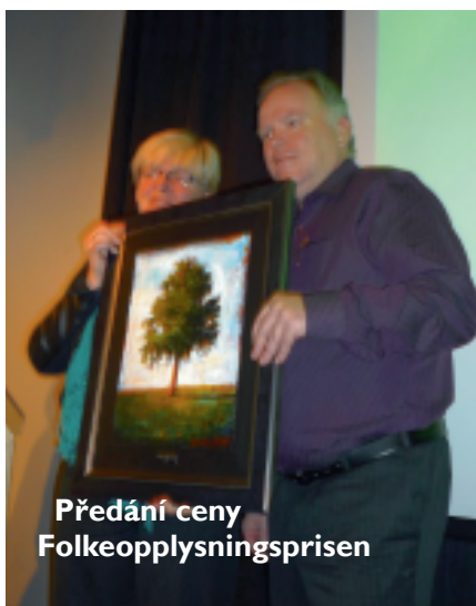
Předání ceny Folkeopplysningsprisen

Nadace spustila první soutěž v psaní kódu . Autoři se mohli pokusit naprogramovat například implementaci nahrávání souborů z mobilních zařízení nebo o aplikaci na prezentaci obrázků typu slideshow. Pět předložených