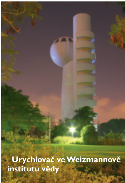
Urychlovač ve Weizmannově institutu vědy

Na Wikizdrojích najdeme i kompletní znění Deklarace nezávislosti státu Izrael, včetně následující věty: „Podáváme všem sousedním státům a jejich národům ruku ke smíru a k dobrému sousedství a apelujeme na ně, aby vzá-