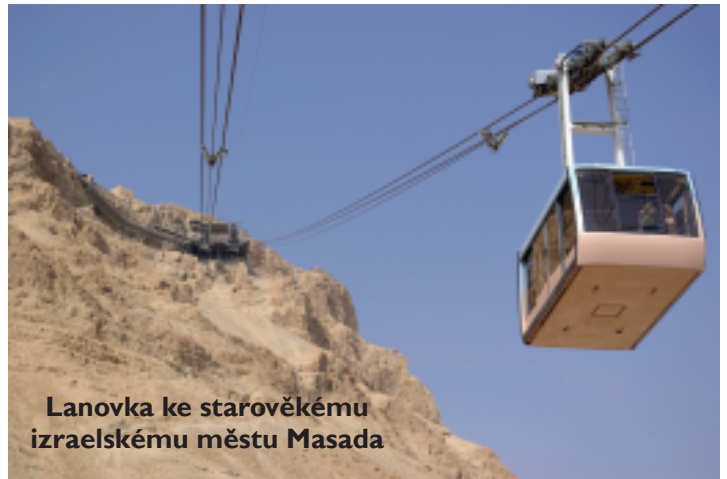
Lanovka ke starověkému izraelskému městu Masada

Podrobně se Wikipedie věnuje i komplikovaným moderním dějinám Izraele včetně válečných konfliktů se