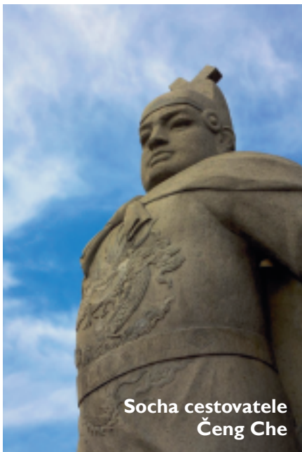
Socha cestovatele Čeng Che

Čínská historie začala ovládat přírůstky v seznamu nejlepších článků české Wikipedie. Nově do něj přibyly tři o cestovateli Čeng Cheovi, jeho loďstvu a plavbách. Za rok 2011 se počet nejlepších článků zatím zvýšil o 14.