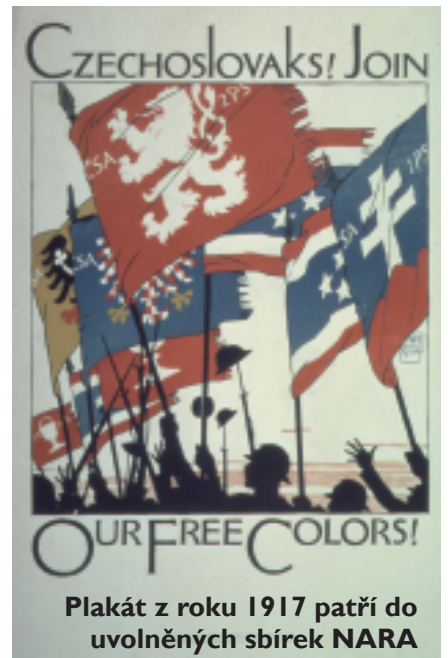
Plakát z roku 1917 patří do uvolněných sbírek NARA

Arbitrážní výbor anglické Wikipedie zasáhl únik jeho interních diskusí , ve kterých členové rozebírali spory mezi wikipedisty, které musejí řešit.