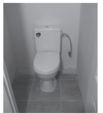
В одному з укриттів.

Нехай цей навчальний рік принесе усім довгоочікуваний мир і перемогу України над ворогом. Нехай у гімназіях, ліцейях і садочках не буде повітряних тривог, учні навчатимуться у своїх класах, здобуваючи знання, підкорюючи нові вершини. Нехай кожен день наповниться позитивними результатами та новим досвідом.